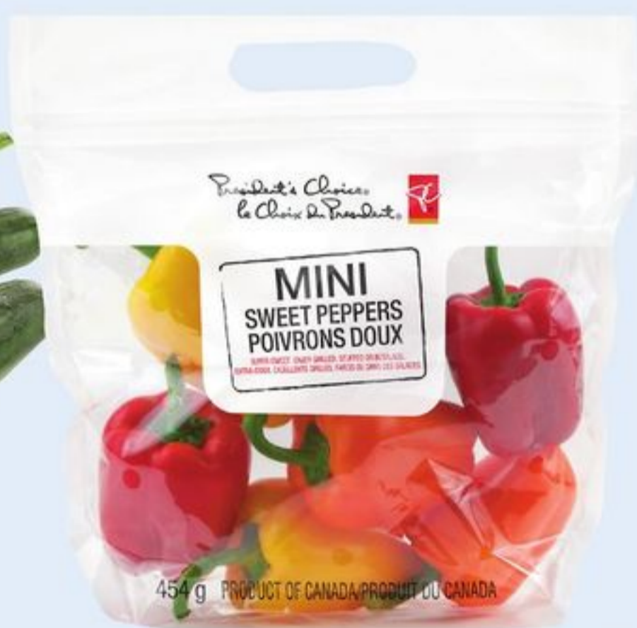
MINI POIVRONS DOUX PC SM PRODUIT DU CANADA 454 G PC SM MINI PEPPERS 20920821001_EA