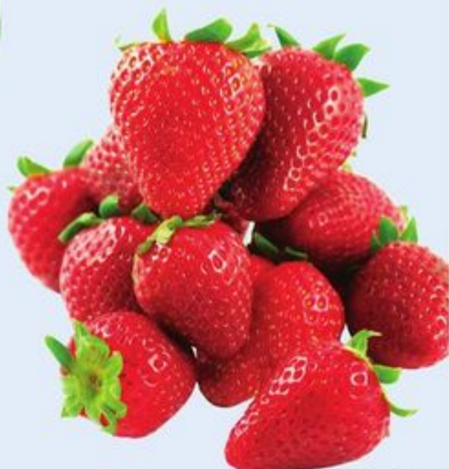
FRAISES CULTIVÉES EN SERRE PRODUIT DU QUÉBEC 591 ML GREENHOUSE GROWN STRAWBERRIES 21181436001_EA