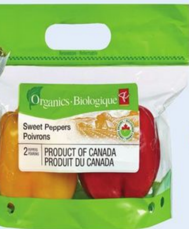
POIVRONS BIOLOGIQUE PC SM PRODUIT DU CANADA 2 UN. PC SM ORGANICS PEPPERS 20690699001_EA