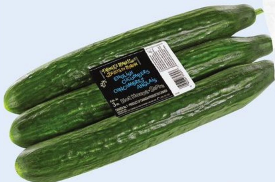
CONCOMBRES ANGLAIS DÉLICES DU MARCHÉ SM PRODUIT DU CANADA 3 UN. FARMER'S MARKET SM ENGLISH CUCUMBERS 21128046001_EA