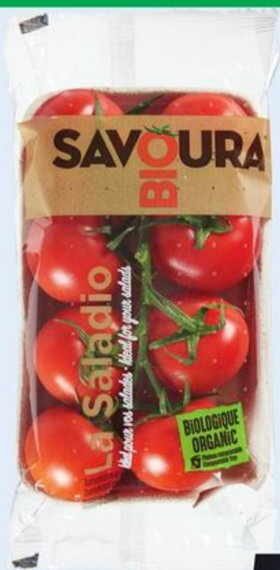
TOMATES SUR VIGNE BIOLOGIQUES SAVOURA PRODUIT DU QUÉBEC 12.10/KG SAVOURA ORGANICS TOMATO ON THE VINE 20127917001_KG