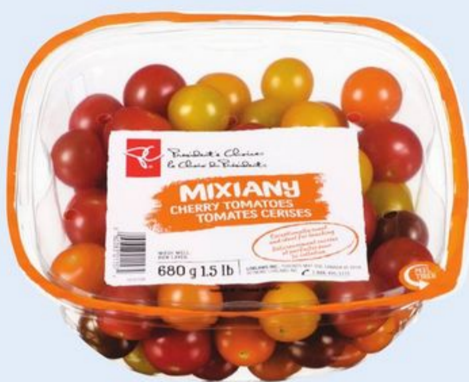
TOMATES CERISES MIXIANY PC SM PRODUIT DU CANADA 680 G PC SM MIXIANY CHERRY TOMATOES 2128588001_EA