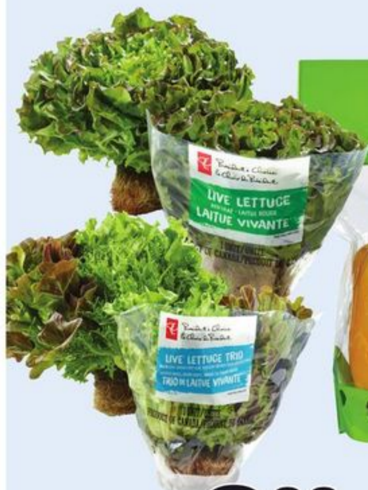
LAITUE VIVANTE PC SM ROUGE OU TRIO PRODUIT DU CANADA CH. PC SM LIVE LETTUCE RED OR TRIO 21506580_EA/21117850_EA