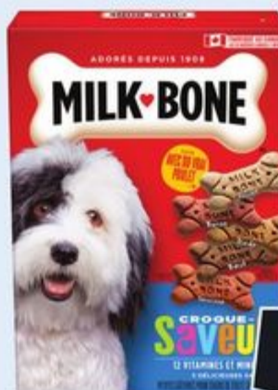
BISCUITS POUR CHIENS MILK-BONE CERTAINES VARIÉTÉS 750-900 G MILK-BONE DOG BISCUITS 21014573_EA