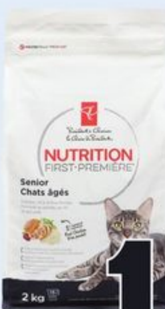
NOURRITURE SÈCHE POUR CHATS PC SM NUTRITION PREMIÈRE SM CERTAINES VARIÉTÉS 2 KG PC SM NUTRITION FIRST SM DRY CAT FOOD 21303270_EA