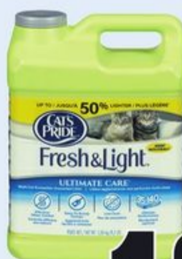
LITIÈRE POUR CHAT FRESH & LIGHT CAT'S PRIDE CERTAINES VARIÉTÉS 3,86 KG CAT'S PRIDE FRESH & LIGHT CAT LITTER 21352107_EA