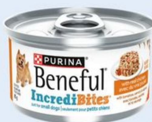
INCREIDIBITES BENEFUL CERTAINES VARIÉTÉS 85 G BENEFUL INCREIDIBITES 21577006_EA