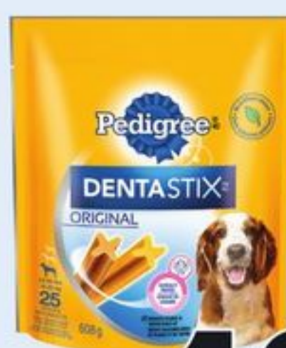
GÂTERIES POUR CHIENS DENTASTIX PEDIGREE CERTAINES VARIÉTÉS 100 G-1,9 KG PEDIGREE DENTASTIX TREATS FOR DOGS 21081180_EA