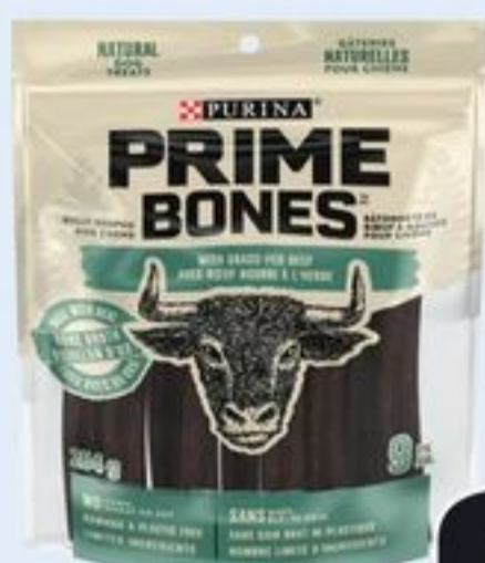
GÂTERIES POUR CHIENS PRIME BONES CERTAINES VARIÉTÉS 264-320 G PRIME BONES DOG TREATS 21550395_EA