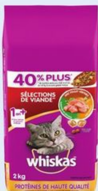
NOURRITURE POUR CHATS WHISKAS CERTAINES VARIÉTÉS 1,5/2 KG WHISKAS CAT FOOD 21588889_EA