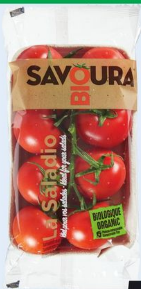
TOMATES SUR VIGNE BIOLOGIQUES SAVOURA PRODUIT DU QUÉBEC 12.10/KG SAVOURA ORGANICS TOMATO ON THE VINE 20127917001_KG