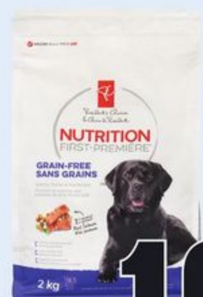
NOURRITURE POUR CHIENS PC SM NUTRITION PREMIÈRE SM CERTAINES VARIÉTÉS 2 KG PC SM NUTRITION FIRST SM DOG FOOD 21307661_EA