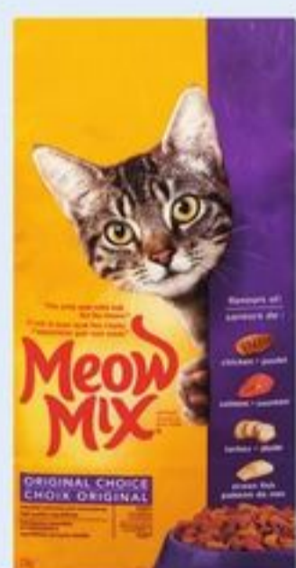
NOURRITURE POUR CHATS MEOW MIX CERTAINES VARIÉTÉS 1,36-2 KG MEOW MIX CAT FOOD 20096001001_EA/21565150_EA