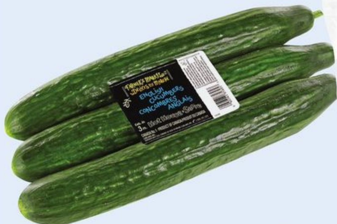
CONCOMBRES ANGLAIS DÉLICES DU MARCHÉ SM PRODUIT DU CANADA 3 UN. FARMER'S MARKET SM ENGLISH CUCUMBERS 21128046001_EA