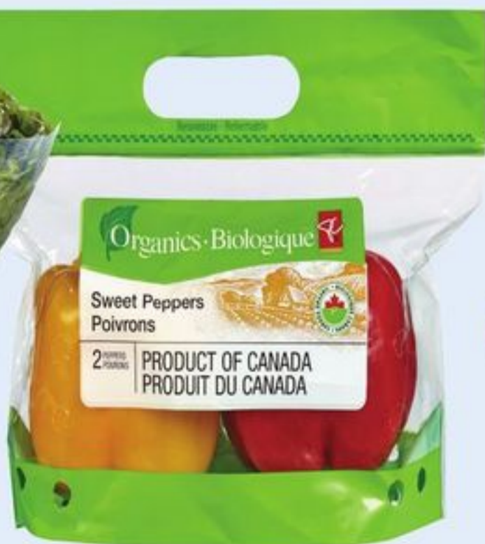
POIVRONS BIOLOGIQUE PC SM PRODUIT DU CANADA 2 UN. PC SM ORGANICS PEPPERS 20690699001_EA