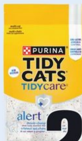
LITIÈRE POUR CHATS ALERTE TIDY CATS 3,63 KG TIDYCATS ALERT CAT LITTER 21581080_EA