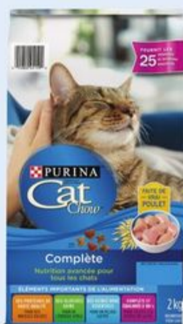
NOURRITURE POUR CHATS CAT CHOW PURINA CERTAINES VARIÉTÉS 1,42-2 KG PURINA CAT CHOW 20319556001_EA