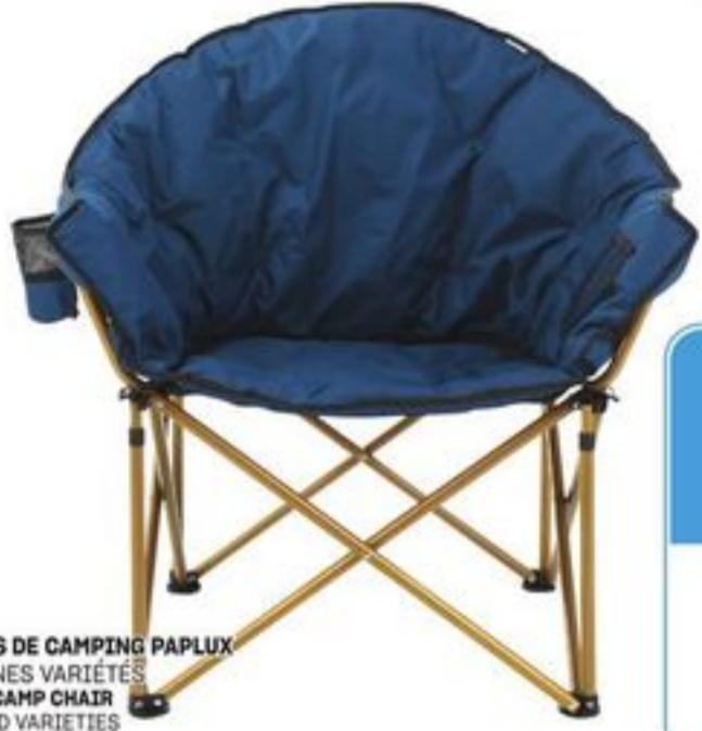
CHAISES DE CAMPING PAPLUX CERTAINES VARIÉTÉS PAPLUX CAMP CHAIR SELECTED VARIETIES 21456922_EA