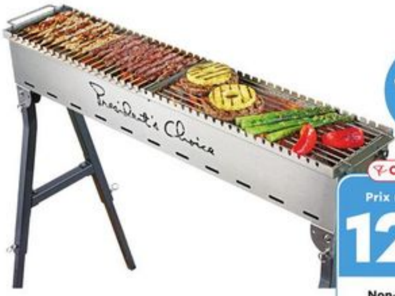
GRILL À SPIEDINI AU CHARBON PC™ GARANTIE LIMITÉE DE 5 ANS PC® SPIEDINI GRILL LIMITED 5 YEAR WARRANTY 21524440_EA