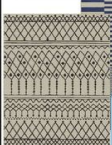
TAPIS TISSÉ LIFE AT HOME™ 2 X 2,5 M CERTAINES VARIÉTÉS LIFE AT HOME® WOVEN CARPET SELECTED VARIETIES 21544823_EA/21544829_EA