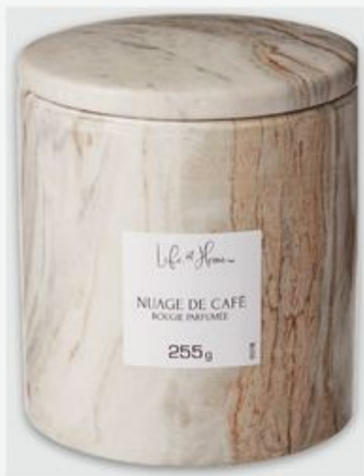
bougie à 1 mèche Life at Home MC certaines variétés Life at Home™ single wick candle selected varieties 255 g 10 $ ch. 2141410_EA