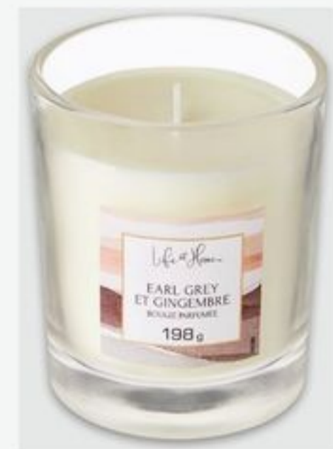
bougie à 1 mèche Life at Home MC certaines variétés Life at Home™ single wick candle selected varieties 198 g 10 $ ch. 2141403_EA

Des essences réconfortantes de fleur d'amandier, de vanille et de musc soyeux sont infusées dans des nuances de jolies fleurs blanches.