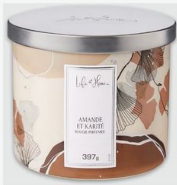
bougie à 3 mèches Life at Home MC certaines variétés Life at Home™ 3 wick candle selected varieties 397 g 16 $ ch. 2141374_EA

*le deuxième article doit être de valeur équivalente ou moindre/second item must be of equal or lesser value