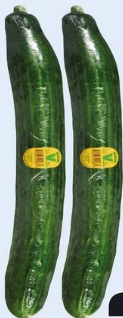
QUÉBEC CONCOMBRES ANGLAIS BIOLOGIQUES PRODUIT DU QUÉBEC CH. ORGANIC ENGLISH CUCUMBERS 20080489001_EA