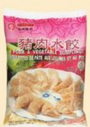
BOULETTES DE PÂTE O'TASTY CERTAINES VARIÉTÉS, SURGÉLÉES 567 G O'TASTY DUMPLINGS 20319243001_EA