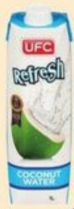
EAU DE NOIX DE COCO REFRESH UFC 1 L UFC REFRESH COCONUT WATER 20570506_EA