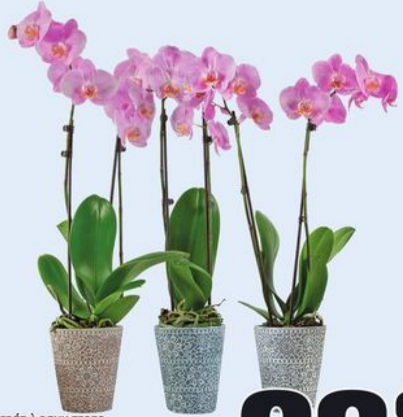
ORCHIDÉE À DEUX TIGES DANS UN POT EN CÉRAMIQUE CERTAINES VARIÉTÉS CH. DOUBLE SPIKE ORCHID IN CERAMIC 20293541_EA