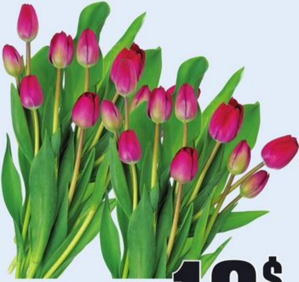
10 TULIPES SUR TIGE CERTAINES VARIÉTÉS CH. 10 STEM TULIPS 21524898_EA/21523713_EA