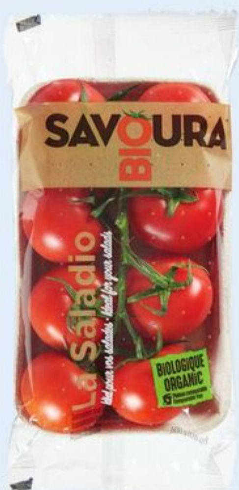
TOMATES BIOLOGIQUES SAVOURA SUR VIGNE PRODUIT DU CANADA 12.10/KG SAVOURA ORGANICS TOMATOES ON THE VINE 20127917001_KG