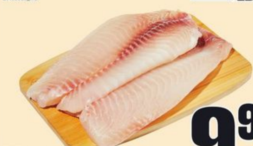
FILETS DE TILAPIA FRAIS ASC 22,02/KG FRESH ASC TILAPIA FILLETS 20897812_KG