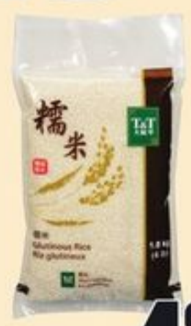
RIZ GLUTINEUX T&T™ 1,8 KG T&T™ GLUTINOUS RICE 20828956_EA