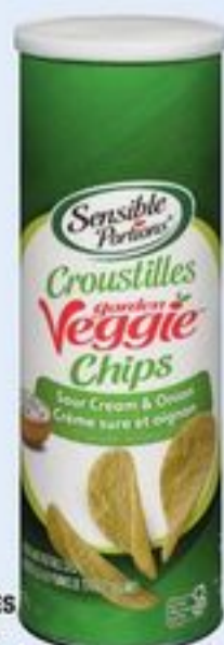
PAILLES AUX LÉGUMES SENSIBLE PORTIONS CERTAINES VARIÉTÉS 120-142 G SENSIBLE PORTIONS VEGGIE STRAWS 20377204001_EA/20973247_EA