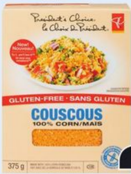
COUSCOUS SANS GLUTEN PC SM CERTAINES VARIÉTÉS 375 G PC SM GLUTEN-FREE COUSCOUS 20749043_EA