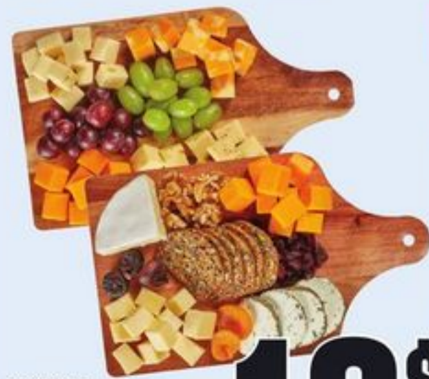
PLATEAU DE FROMAGES DE BASE CERTAINES VARIÉTÉS 412-432 G BACK TO BASICS CHEESE BOARD 21405571_EA/21405538_EA