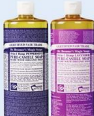
SAVON DE CASTILLE DR. BRONNER'S CERTAINES VARIÉTÉS 946 ML DR. BRONNER'S CASTILE SOAP 20360359001_EA 20360359003_EA