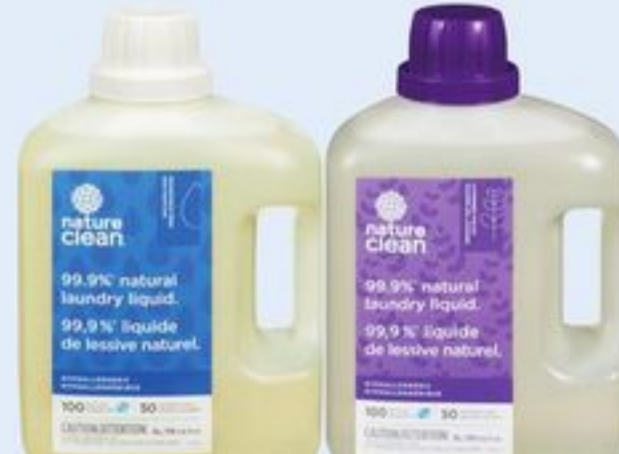
DÉTERGENT LIQUIDE À LESSIVE NATURE CLEAN CERTAINES VARIÉTÉS 3 L NATURE CLEAN LIQUID LAUNDRY WASH 20067905_EA/21205741_EA