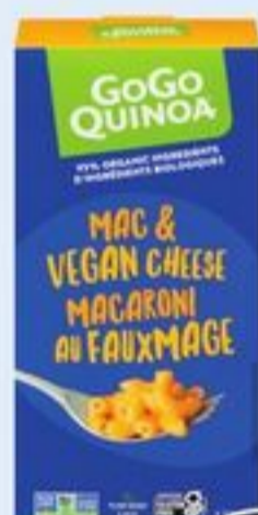
MACARONI AU FAUXMAGE GOGO QUINOA CERTAINES VARIÉTÉS 170 G GOGO QUINOA MAC & VEGAN CHEESE 21380709_EA