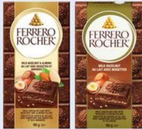
BARRES FERRERO ROCHER CERTAINES VARIÉTÉS 90 G FERRERO ROCHER TABLETS 21428863_EA 21570452_EA