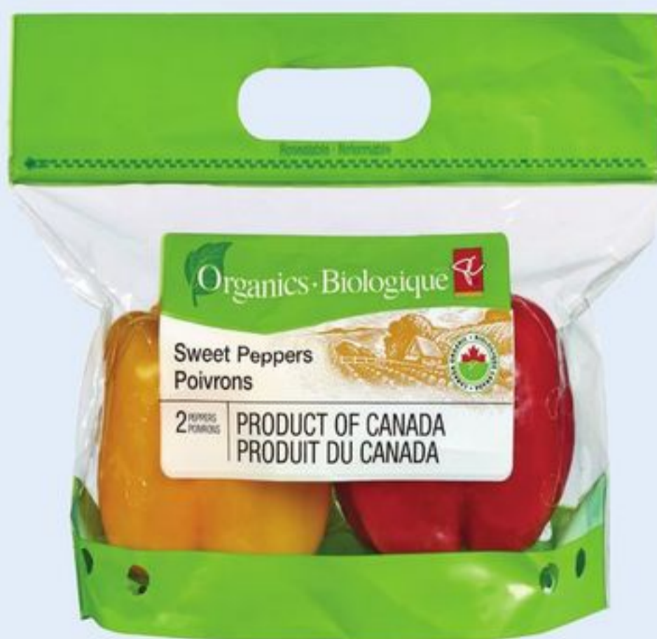
POIVRONS PC™ BIOLOGIQUE PRODUIT DU CANADA 2 UN. PC® ORGANICS PEPPERS 20690699001_EA