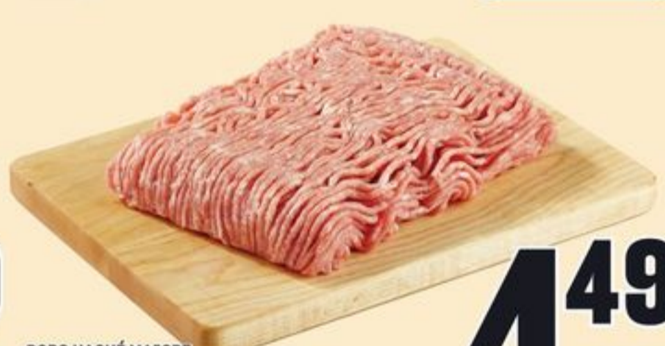
PORC HACHÉ MAIGRE 9,90/KG LEAN GROUND PORK 20312576_EA