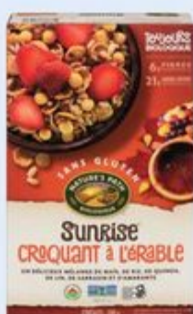
GRUAU SANS GLUTEN PC SM BIOLOGIQUE, 900 G OU CÉRÉALES SUNRISE NATURES PATH 300 G CERTAINES VARIÉTÉS PC SM ORGANICS GLUTEN-FREE ROLLED OATS OR NATURES PATH SUNRISE CEREAL 20043938001_EA/21396198_EA