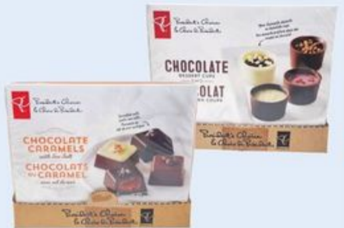
COLLECTION DE DESSERTS 145 G OU CHOCOLATS AVEC CAMEL AU SEL DE MER 158 G PC SM PC SM BAR DESSERT COLLECTION OR CHOCOLATE SALTED CARAMELS 21197993_EA 21200083_EA