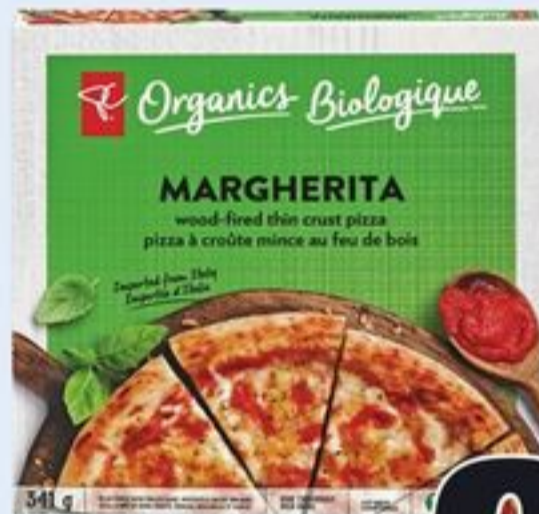
PIZZA OU BRETZEL PC SM SANS GLUTEN CERTAINES VARIÉTÉS 340-400 G PC SM GLUTEN-FREE PIZZA OR PRETZEL 21092254_EA/21092257_EA/21092293_EA