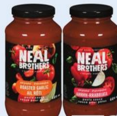
SAUCE POUR PÂTES BIOLOGIQUE NEAL BROTHERS CERTAINES VARIÉTÉS 690 ML NEAL BROTHERS ORGANIC PASTA SAUCE 21306298_EA/21306341_EA