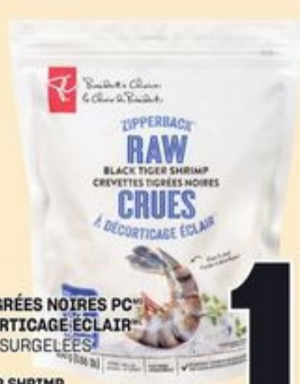
CREVETTES TIGRÉES NOIRES PC™ CRUES, À DÉCORTICAGE ÉCLAIR™ 16-20 PAR LB, SURGÉLÉES 400 G PC™ BLACK TIGER SHRIMP RAW ZIPPERBACK™ 20801192_EA