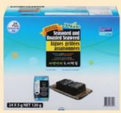
ALGUES GRILLÉES JAYONE 24 UN. JAYONE ROASTED SEAWEED 20699445_EA