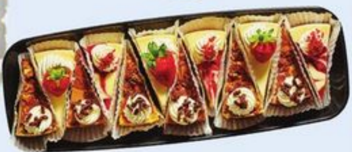
PLATEAU DE GÂTEAUX AU FROMAGE 108 G CHEESECAKE TRAY 20696282_EA