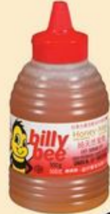
MIEL BILLY BEE 500 G BILLY BEE HONEY 21001564_EA