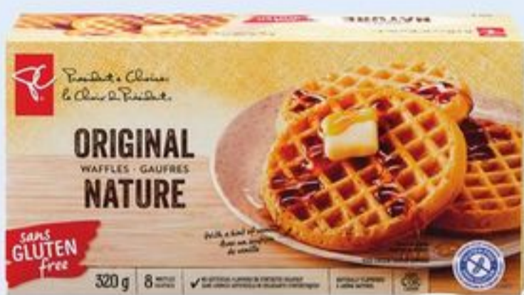
GAUFRES SANS GLUTEN PC SM OU SOUFFLÉS DE MAÏS PC SM BIOLOGIQUE CERTAINES VARIÉTÉS 142/320 G PC SM GLUTEN-FREE WAFFLES OR PC SM ORGANICS VEGAN PUFFS 21358684_EA/21419163_EA