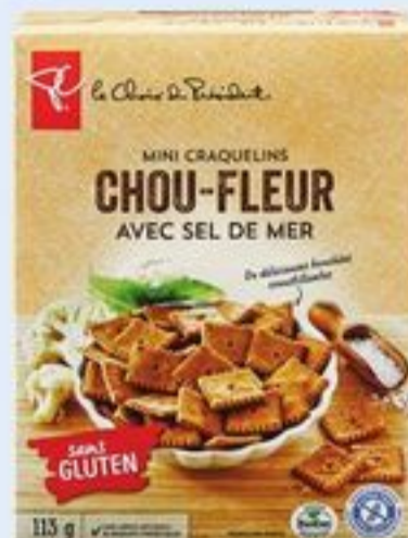
MÉLANGE À CRÊPES PC SM BIOLOGIQUE 900 G OU CRAQUELINS PC SM SANS GLUTEN 113 G CERTAINES VARIÉTÉS PC SM ORGANICS PANCAKE MIX OR PC SM GLUTEN FREE CRACKERS 20898499_EA/21471630_EA