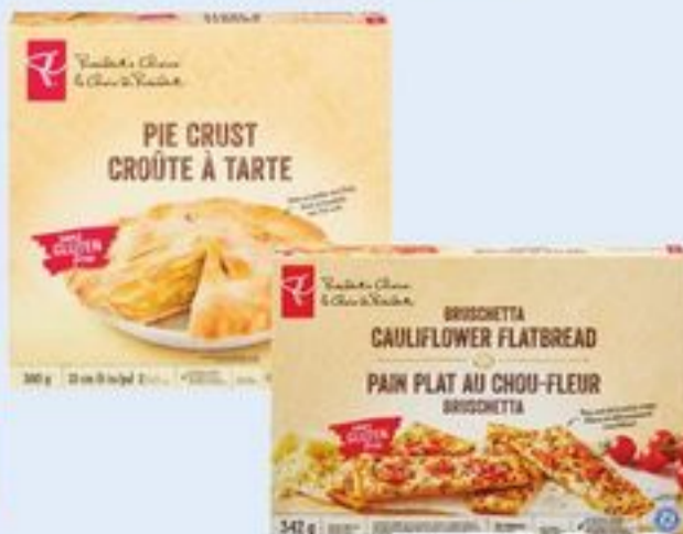
CRÔUTE À TARTE OU PAIN PLAT AU CHOU-FLEUR PC SM SANS GLUTEN CERTAINES VARIÉTÉS 342-380 G PC SM GLUTEN FREE PIE CRUST OR CAULIFLOWER FLATBREAD 21311742_EA/21395544_EA