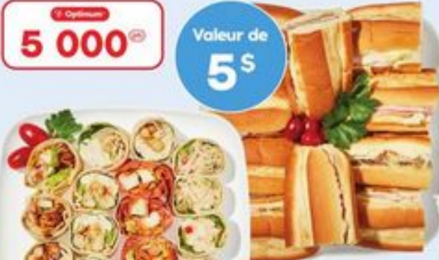
PLATEAU DE ROULÉS OU PETIT PLATEAU DE SOIR DE MATCH CH. PIN WHEELS WRAP OR SMALL GAME NIGHT PLATTER 21558135_EA/21557919_EA