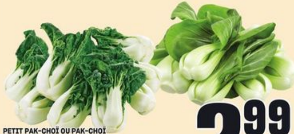
PETIT PAK-CHOÏ OU PAK-CHOÏ SHANGHAI PRODUIT DU MEXIQUE 6,59/KG BABY OR SHANGHAI BOK CHOY 20082279001_KG / 20032454001_KG