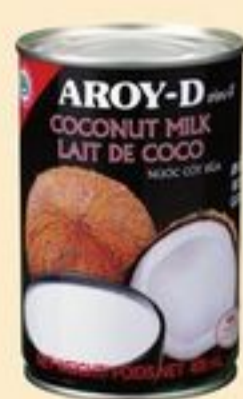
LAIT DE COCO AROY-D CERTAINES VARIÉTÉS 400 ML AROY-D COCONUT MILK 20063864_EA