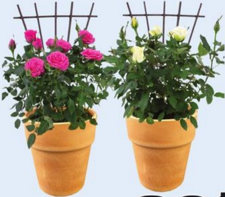
MINI-ROSIER AVEC TREILLIS CERTAINES VARIÉTÉS CH. MINI ROSE WITH TRELLIS 21524787_EA