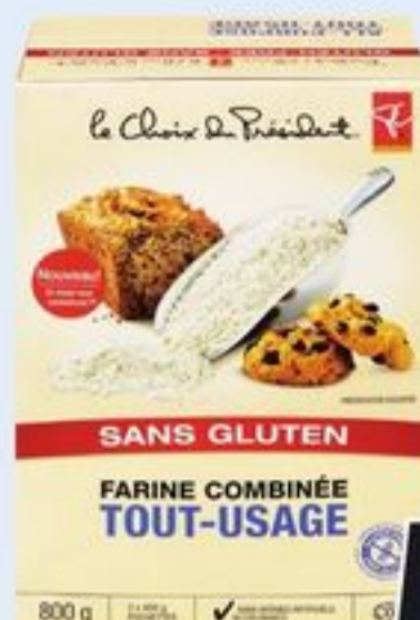
MÉLANGE À GÂTEAU OU FARINE SANS GLUTEN PC SM BIOLOGIQUE CERTAINES VARIÉTÉS 400/800 G PC SM ORGANICS GLUTEN-FREE CAKE MIX OR FLOUR 20809079_EA