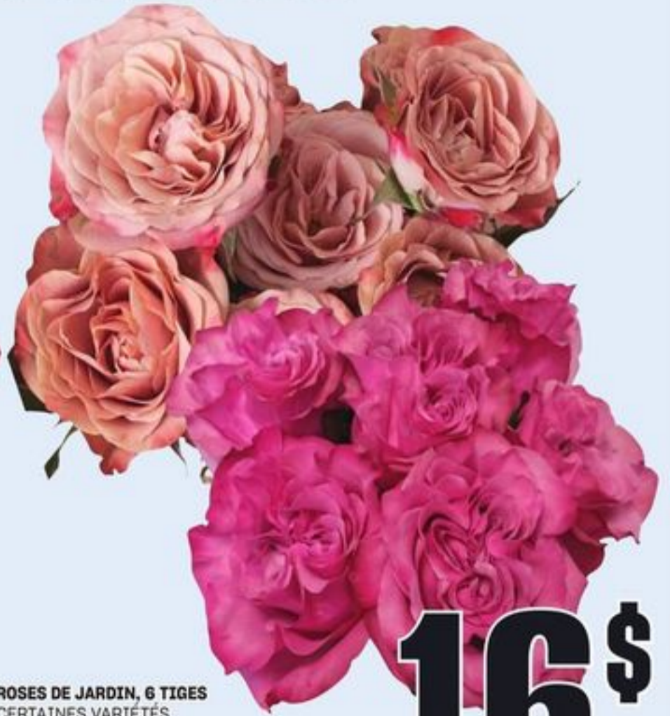
ROSES DE JARDIN, 6 TIGES CERTAINES VARIÉTÉS CH. GARDEN ROSES 6 STEM 21602414_EA