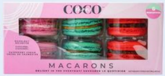
MACARON COCO BAKERY CERTAINES VARIÉTÉS 6 UN. COCO BAKERY MACARON 21587432_EA