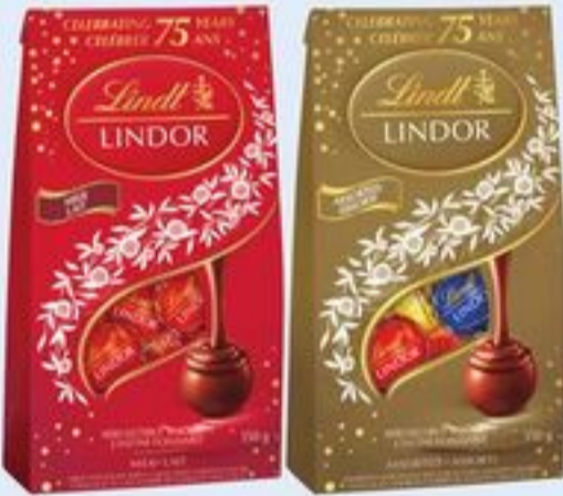
SACS DE CHOCOLAT LINDOR OU GHIRARDELLI CERTAINES VARIÉTÉS 116-151 G LINDOR OR GHIRARDELLI CHOCOLATE BAGS 21390291_EA 21390363_EA