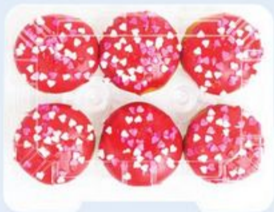
MINI-BEIGNES DE LA FÊTE DES MÈRES 6 UN. MINI MOTHER'S DAY DONUTS 21355442_EA