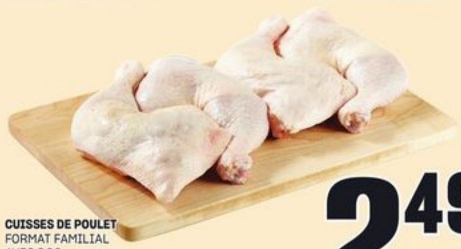
CUISSES DE POULET FORMAT FAMILIAL AVEC DOS 5,49/KG CHICKEN LEGS 20153925_KG

Optimum Prix membres™ 99¢ Non-membres 1 49