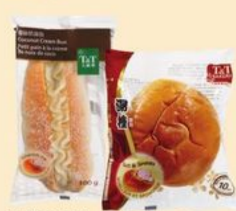
PETITS PAINS DE BOULANGERIE T&T™ CERTAINES VARIÉTÉS 90/100 G T&T™ BAKERY BUNS 20332833_EA 20334565_EA