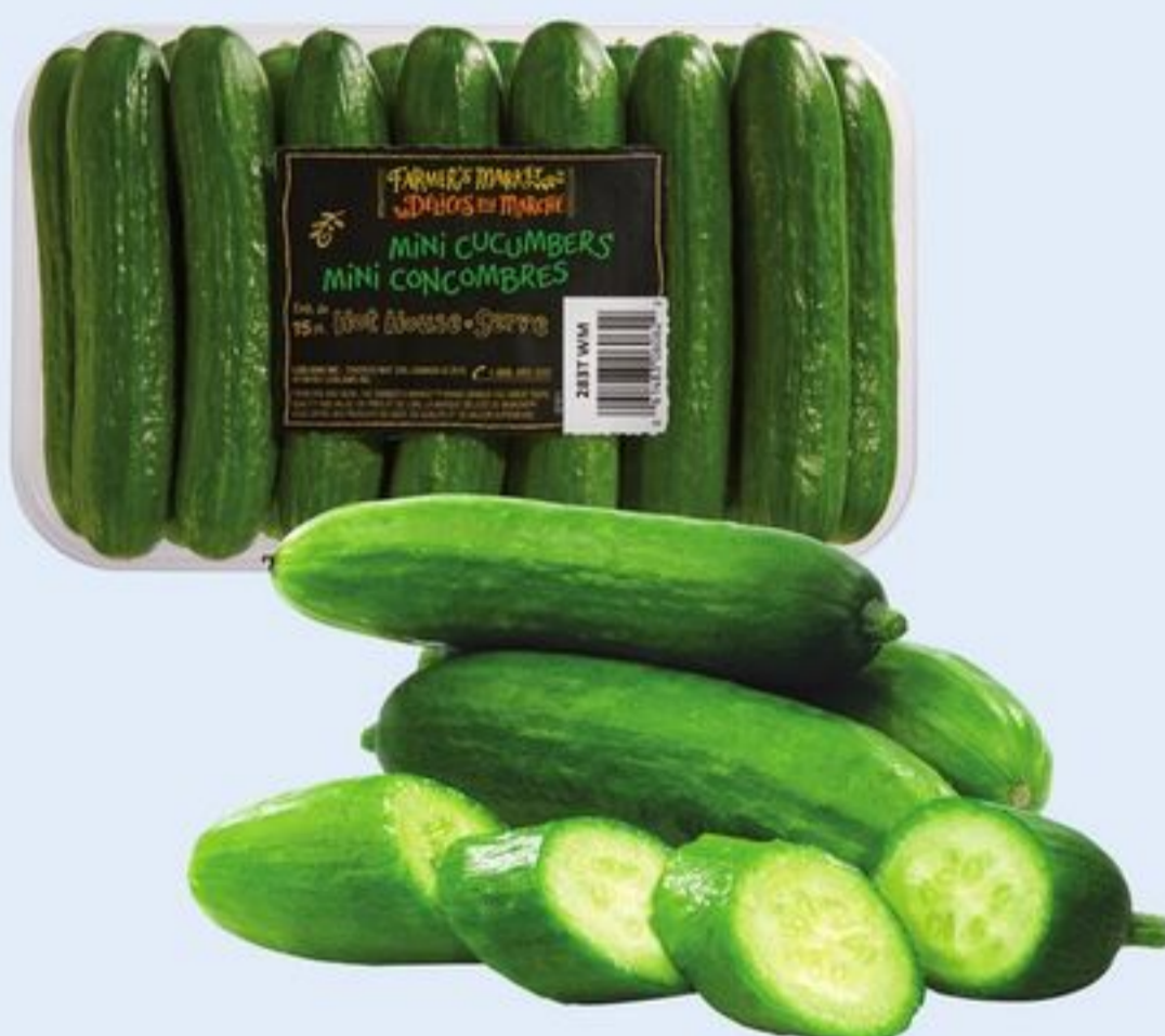
MINI-CONCOMBRES DÉLICIES DU MARCHÉ™ PRODUIT DU CANADA 11 UN. FARMER'S MARKET™ MINI CUCUMBERS 21070679001_EA