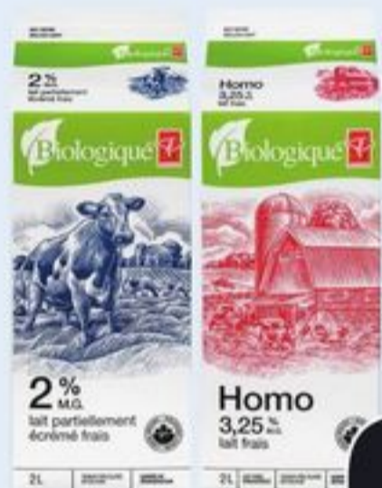
LAIT PC SM BIOLOGIQUE CERTAINES VARIÉTÉS 2 L PC SM ORGANIC MILK 20700685_EA/20700686_EA