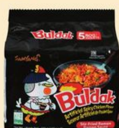
RAMEN SAMYANG BULDAK CERTAINES VARIÉTÉS 650-700 G SAMYANG BULDAK RAMEN 21345870_C05