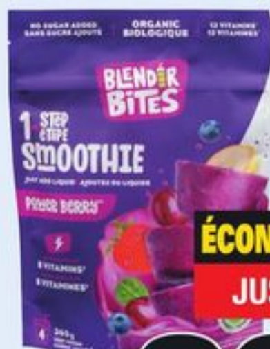
AMYS KITCHEN OU BLENDER BITES CERTAINES FORMATS ET VARIÉTÉS AMYS KITCHEN OR BLENDER BITES 20042092002_EA/21535627_EA