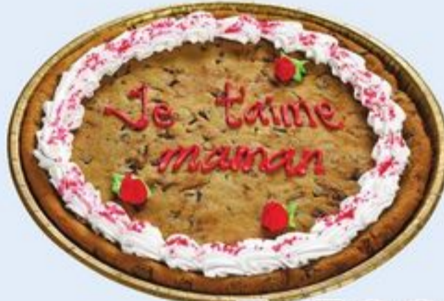
GÂTEAU-BISCUITS CUIT AVEC MESSAGE POUR LA FÊTE DES MÈRES 612 G BAKED MOTHER'S DAY MESSAGE COOKIE CAKE 20966119_C10