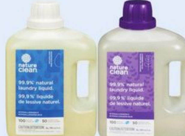
DÉTERGENT LIQUIDE À LESSIVE NATURE CLEAN CERTAINES VARIÉTÉS 3 L NATURE CLEAN LIQUID LAUNDRY WASH 20067905_EA/21205741_EA