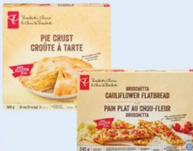
CRÔUTE À TARTE OU PAIN PLAT AU CHOU-FLEUR PC SM SANS GLUTEN CERTAINES VARIÉTÉS 342-380 G PC SM GLUTEN FREE PIE CRUST OR CAULIFLOWER FLATBREAD 21311742_EA/21395544_EA