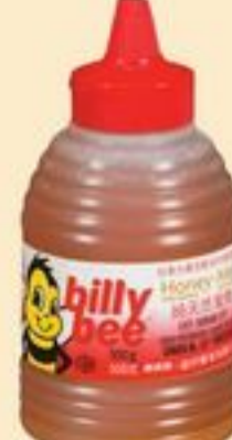
MIEL BILLY BEE 500 G BILLY BEE HONEY 21001564_EA