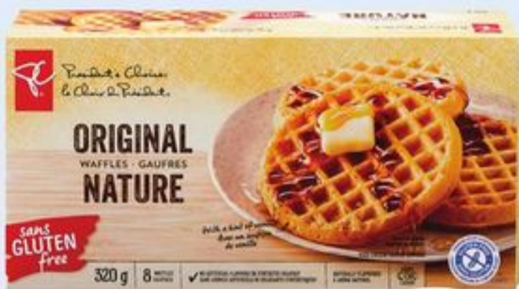
GAUFRES SANS GLUTEN PC SM OU SOUFFLÉS DE MAÏS PC SM BIOLOGIQUE CERTAINES VARIÉTÉS 142/320 G PC SM GLUTEN-FREE WAFFLES OR PC SM ORGANICS VEGAN PUFFS 21358684_EA/21419163_EA