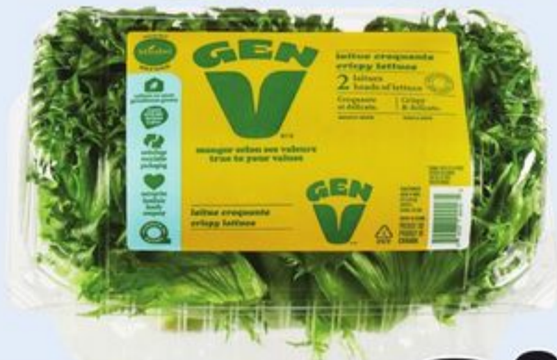
DUO LAITUE BOSTON, CROQUANTE OU SALANOVA ROUGE ET VERTE GEN V PRODUIT DU CANADA 2 UN. GEN V BOSTON DUO, CRISPY OR RED & GREEN SALANOVA LETTUCE 20686537_EA/21350918_EA