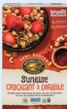
GRUAU SANS GLUTEN PC SM BIOLOGIQUE, 900 G OU CÉRÉALES SUNRISE NATURES PATH 300 G CERTAINES VARIÉTÉS PC SM ORGANICS GLUTEN-FREE ROLLED OATS OR NATURES PATH SUNRISE CEREAL 20043938001_EA/21396198_EA