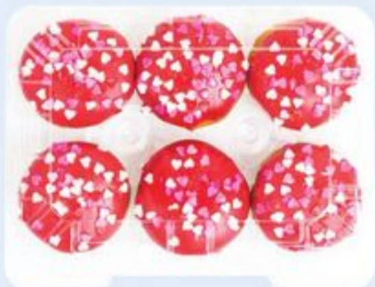
MINI-BEIGNES DE LA FÊTE DES MÈRES 6 UN. MINI MOTHER'S DAY DONUTS 21355442_EA