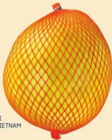
POMÉLO ROUGE PRODUIT DU VIETNAM RED POMELO 20081390001_KG

cliquez ici pour magasiner notre assortiment complet