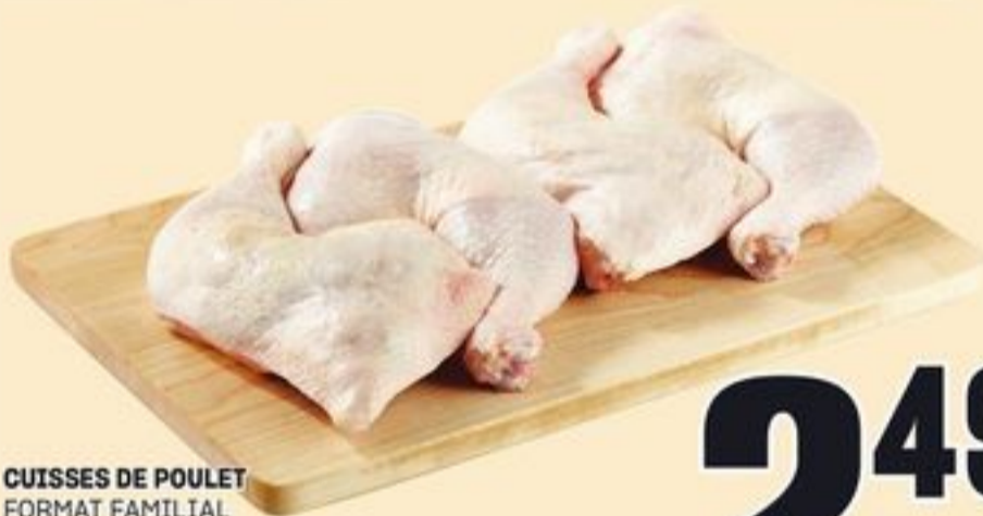
CUISSES DE POULET FORMAT FAMILIAL AVEC DOS 5,49/KG CHICKEN LEGS 20153925_KG