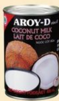
LAIT DE COCO AROY-D CERTAINES VARIÉTÉS 400 ML AROY-D COCONUT MILK 20063864_EA