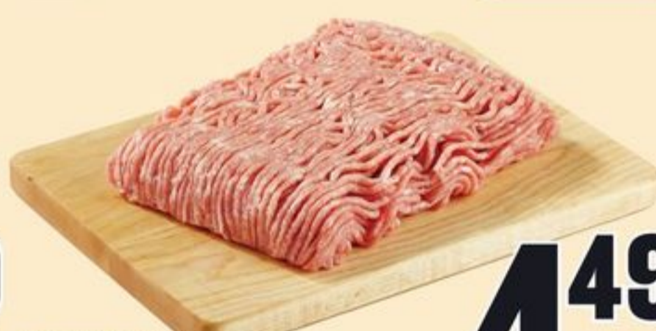
PORC HACHÉ MAIGRE 9,90/KG LEAN GROUND PORK 20312576_EA