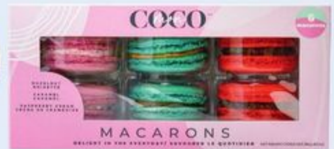
MACARON COCO BAKERY CERTAINES VARIÉTÉS 6 UN. COCO BAKERY MACARON 21587432_EA