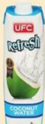
EAU DE NOIX DE COCO REFRESH UFC 1 L UFC REFRESH COCONUT WATER 20570506_EA