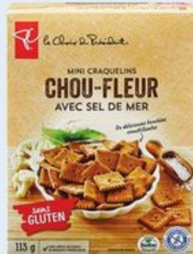
MÉLANGE À CRÊPES PC SM BIOLOGIQUE 900 G OU CRAQUELINS PC SM SANS GLUTEN 113 G CERTAINES VARIÉTÉS PC SM ORGANICS PANCAKE MIX OR PC SM GLUTEN FREE CRACKERS 20898499_EA/21471630_EA