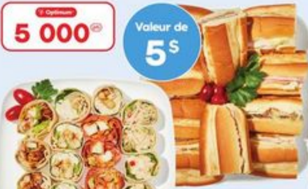
PLATEAU DE ROULÉS OU PETIT PLATEAU DE SOIR DE MATCH CH. PIN WHEELS WRAP OR SMALL GAME NIGHT PLATTER 21558135_EA/21557919_EA