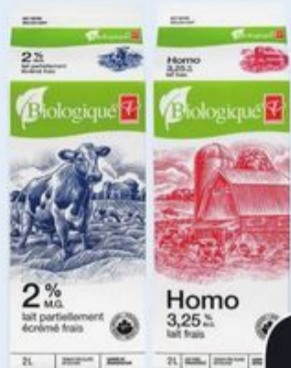
LAIT PC SM BIOLOGIQUE CERTAINES VARIÉTÉS 2 L PC SM ORGANIC MILK 20700685_EA/20700686_EA