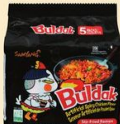
RAMEN SAMYANG BULDAK CERTAINES VARIÉTÉS 650-700 G SAMYANG BULDAK RAMEN 21345870_C05