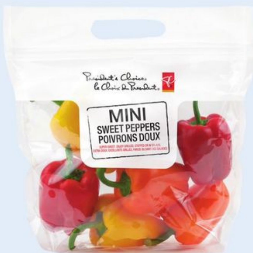
MINI POIVRONS DOUX PC™ PRODUIT DU CANADA 454 G PC® MINI PEPPERS 20920821001_EA