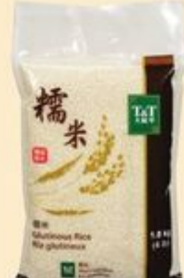
RIZ GLUTINEUX T&T™ 1,8 KG T&T™ GLUTINOUS RICE 20828956_EA