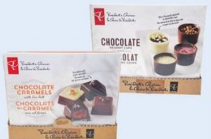
COLLECTION DE DESSERTS 145 G OU CHOCOLATS AVEC CAMEL AU SEL DE MER 158 G PC SM PC SM BAR DESSERT COLLECTION OR CHOCOLATE SALTED CARAMELS 21197993_EA 21200083_EA