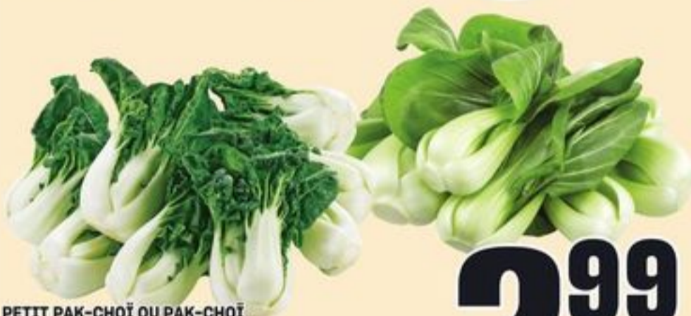
PETIT PAK-CHOÏ OU PAK-CHOÏ SHANGHAI PRODUIT DU MEXIQUE 6,59/KG BABY OR SHANGHAI BOK CHOY 20082279001_KG / 20032454001_KG