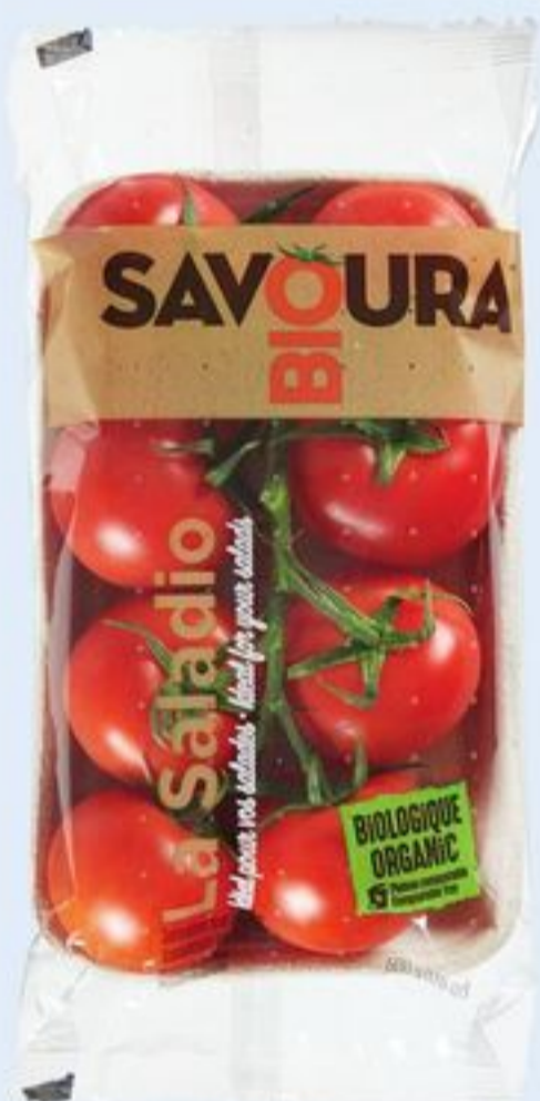
TOMATES BIOLOGIQUES SAVOURA SUR VIGNE PRODUIT DU CANADA 12.10/KG SAVOURA ORGANICS TOMATOES ON THE VINE 20127917001_KG