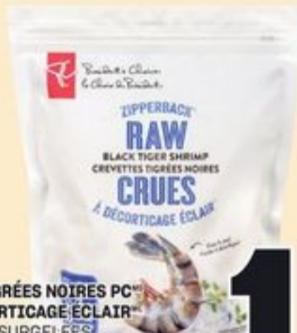
CREVETTES TIGRÉES NOIRES PC™ CRUES, À DÉCORTICAGE ÉCLAIR™ 16-20 PAR LB, SURGÉLÉES 400 G PC™ BLACK TIGER SHRIMP RAW ZIPPERBACK™ 20801192_EA