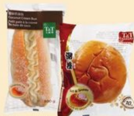
PETITS PAINS DE BOULANGERIE T&T™ CERTAINES VARIÉTÉS 90/100 G T&T™ BAKERY BUNS 20332833_EA 20334565_EA