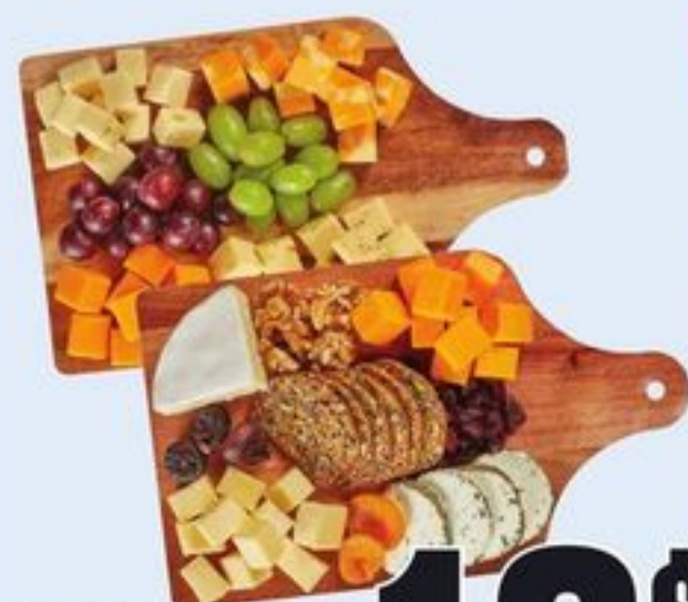
PLATEAU DE FROMAGES DE BASE CERTAINES VARIÉTÉS 412-432 G BACK TO BASICS CHEESE BOARD 21405571_EA/21405538_EA