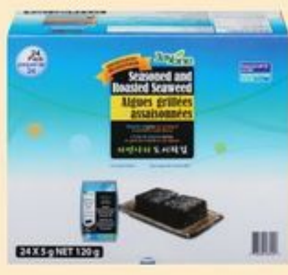
ALGUES GRILLÉES JAYONE 24 UN. JAYONE ROASTED SEAWEED 20699445_EA