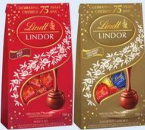
SACS DE CHOCOLAT LINDOR OU GHIRARDELLI CERTAINES VARIÉTÉS 116-151 G LINDOR OR GHIRARDELLI CHOCOLATE BAGS 21390291_EA 21390363_EA