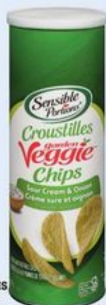
PAILLES AUX LÉGUMES SENSIBLE PORTIONS CERTAINES VARIÉTÉS 120-142 G SENSIBLE PORTIONS VEGGIE STRAWS 20377204001_EA/20973347_EA