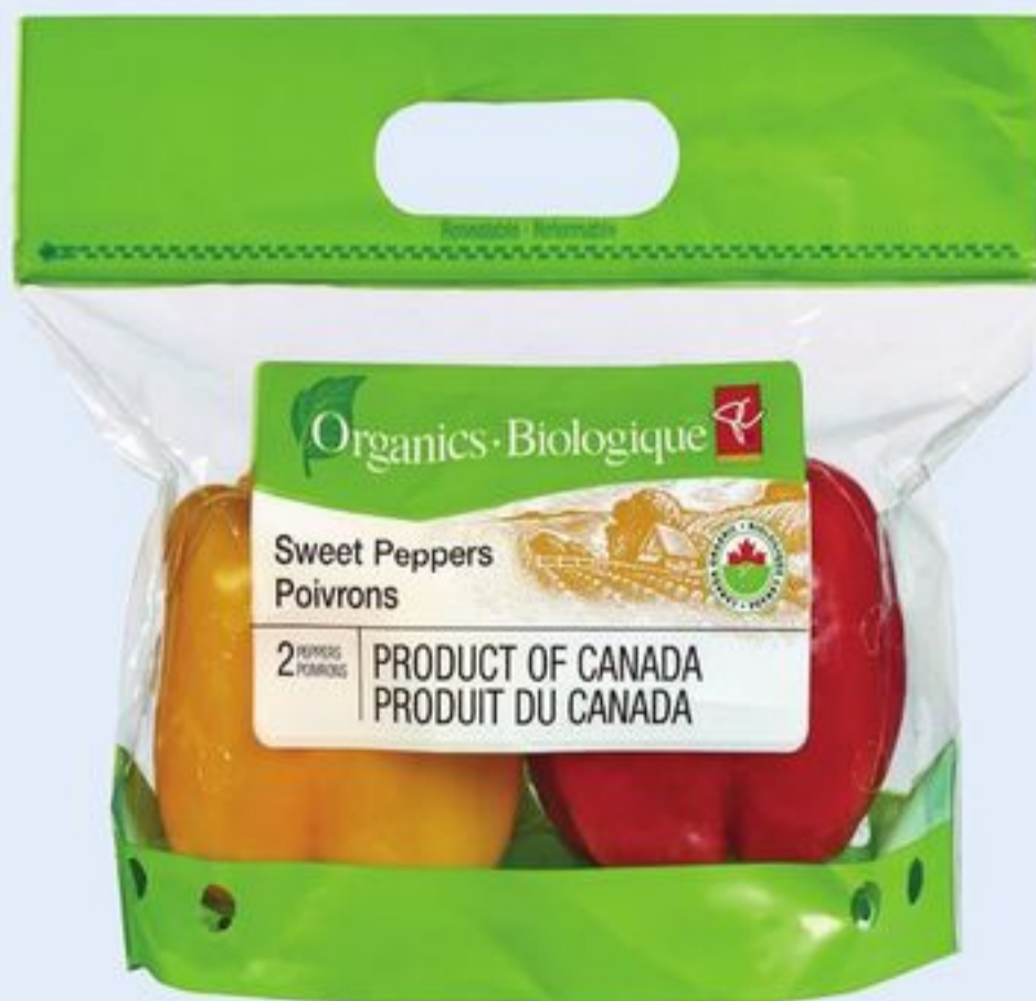
POIVRONS PC™ BIOLOGIQUE PRODUIT DU CANADA 2 UN. PC® ORGANICS PEPPERS 20690699001_EA