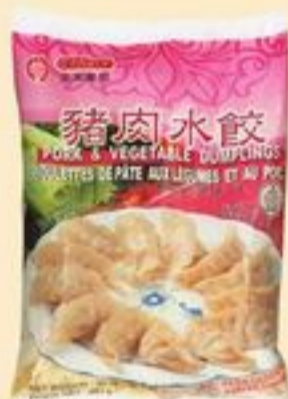
BOULETTES DE PÂTE O'TASTY CERTAINES VARIÉTÉS, SURGÉLÉES 567 G O'TASTY DUMPLINGS 20319243001_EA