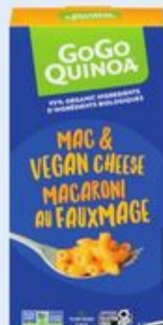
MACARONI AU FAUXMAGE GOGO QUINOA CERTAINES VARIÉTÉS 170 G GOGO QUINOA MAC & VEGAN CHEESE 21380709_EA