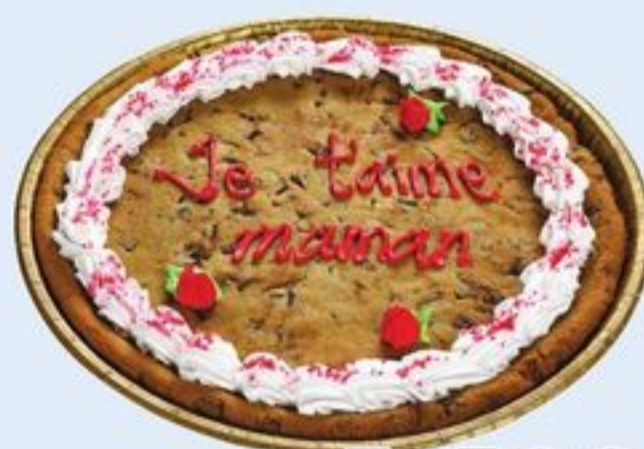
GÂTEAU-BISCUITS CUIT AVEC MESSAGE POUR LA FÊTE DES MÈRES 612 G BAKED MOTHER'S DAY MESSAGE COOKIE CAKE 20966119_C10