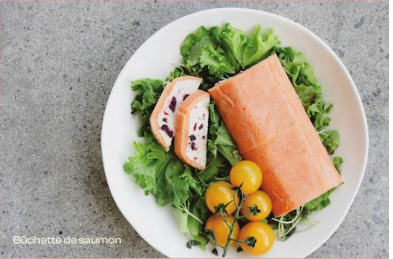
Bûchette de saumon