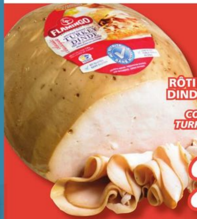
RÔTI DE POITRINE DE DINDE CUIT OU FUMÉ FLAMINGO COOKED OR SMOKED TURKEY BREAST ROAST 13,56 $/lb