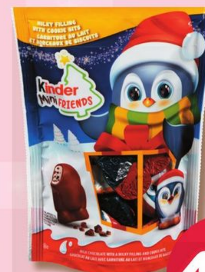
FRIANDISES KINDER MINI FRIENDS TREATS 122 g