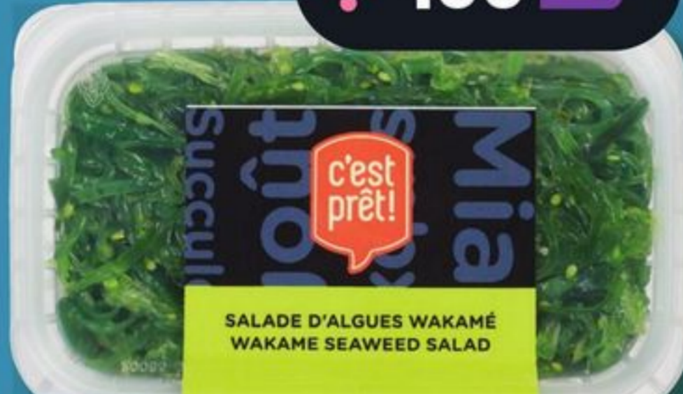
SALADE D'ALGUES WAKAMÉ C'EST PRÊT! WAKAME SEAWEED SALAD 227 g