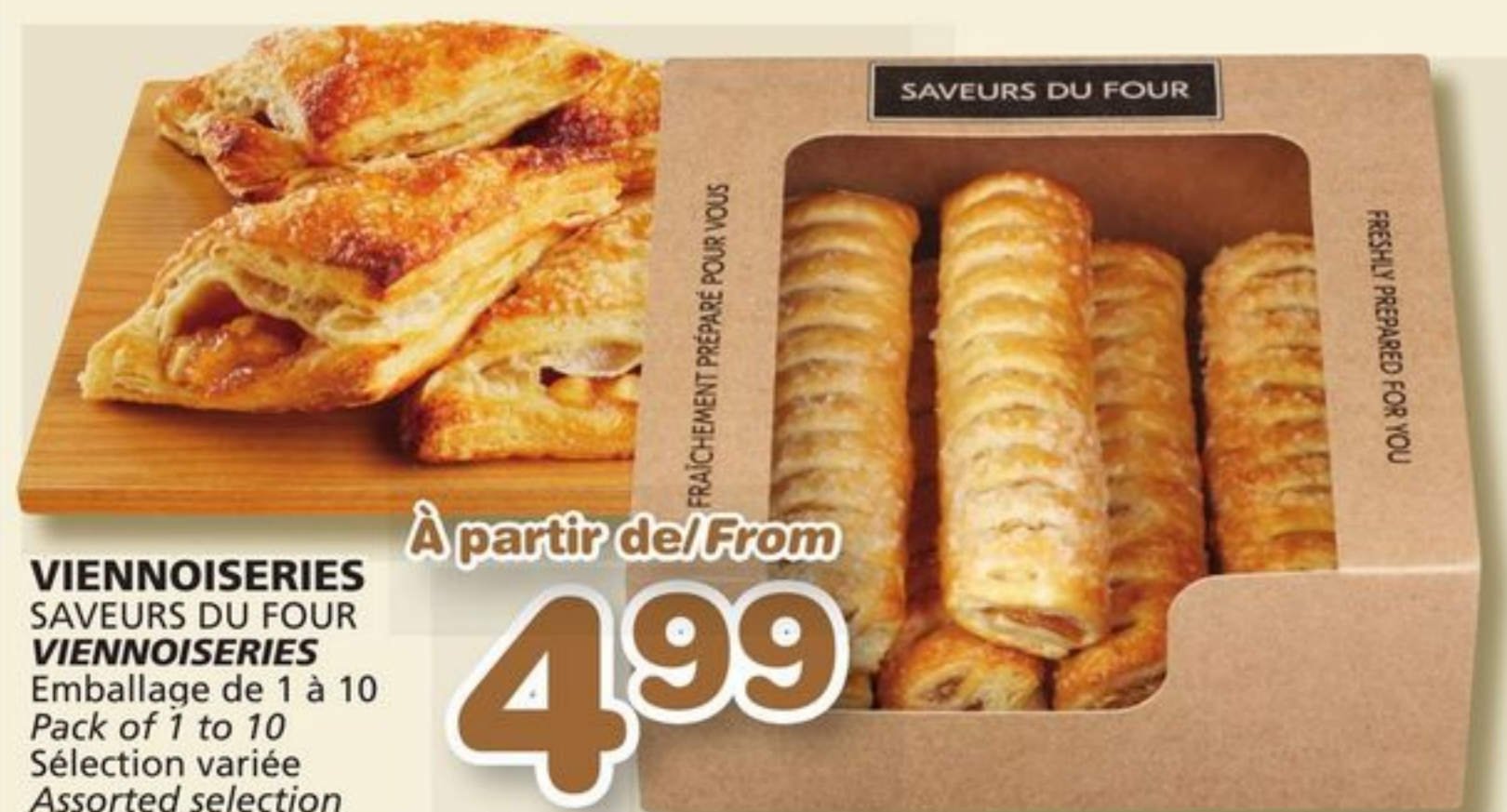
VIENNOISERIES SAVEURS DU FOUR VIENNOISERIES Emballage de 1 à 10 Pack of 1 to 10 Sélection variée Assorted selection