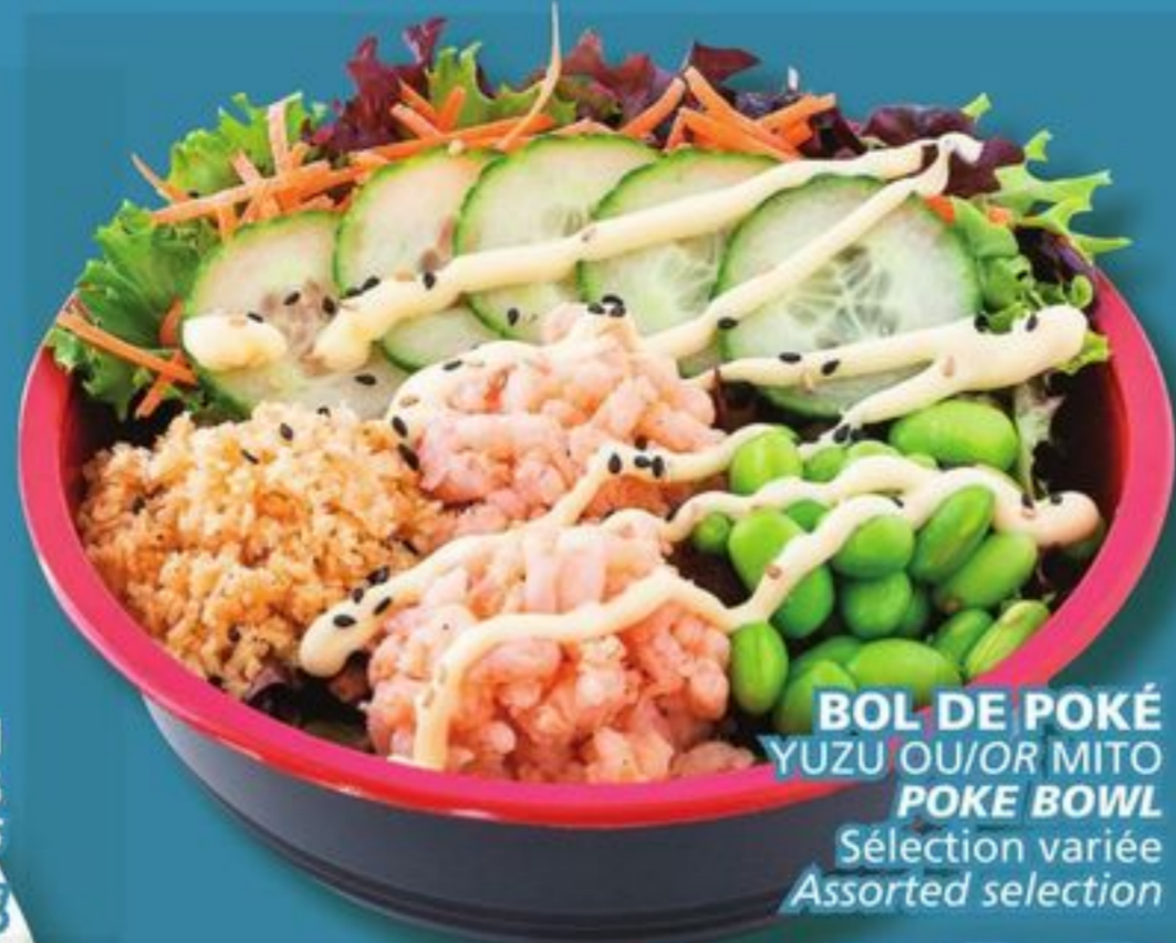
BOL DE POKÉ YUZU OU/OR MITO POKE BOWL Sélection variée Assorted selection