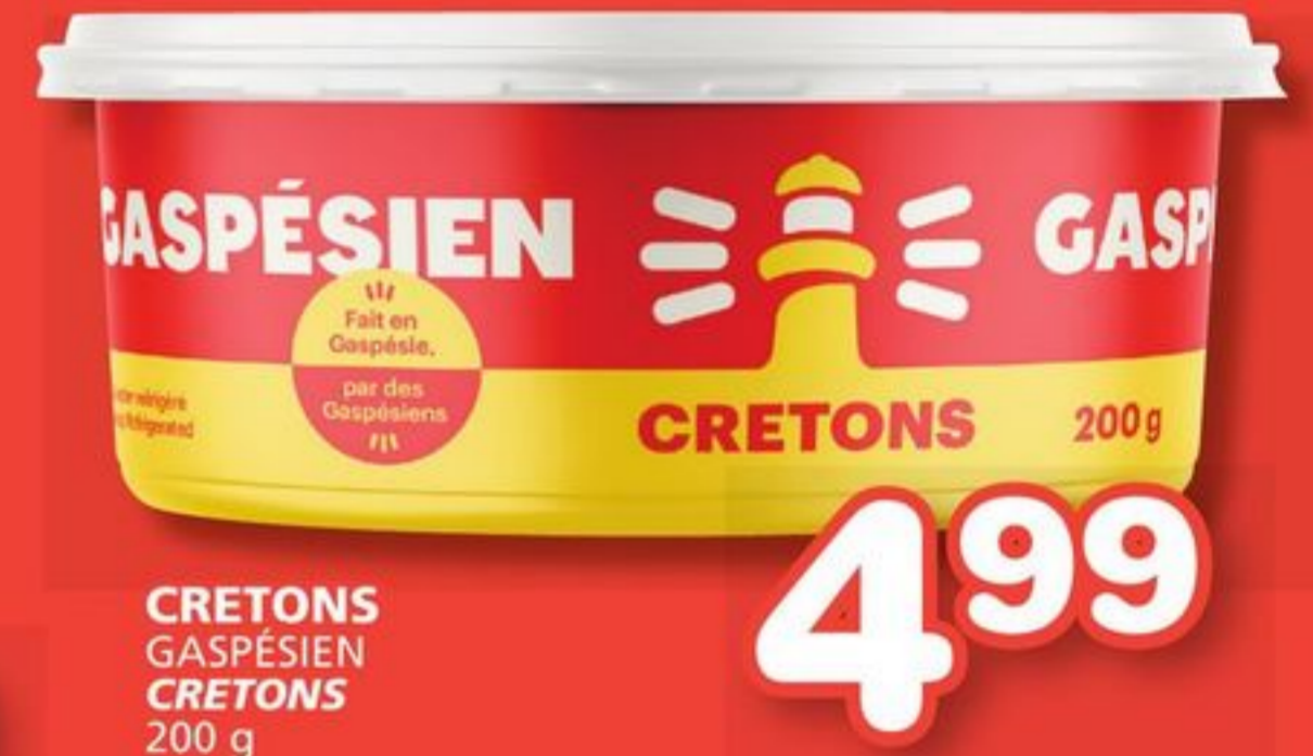
GASPÉSIE CRETONS 200 g