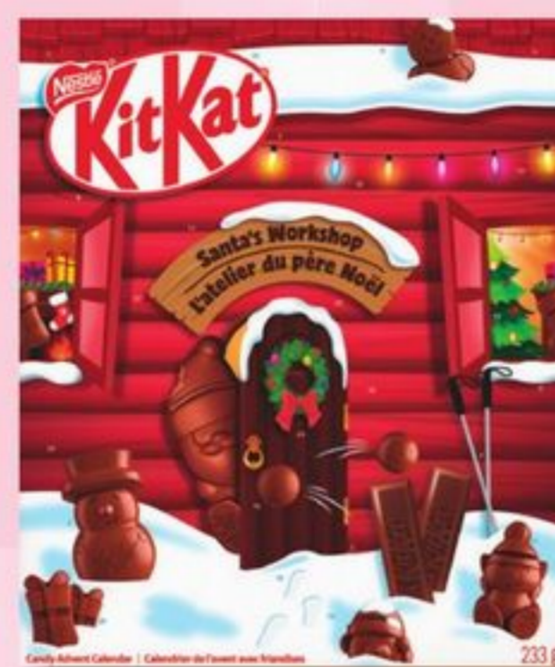
CALENDRIER DE L'AVENT NESTLÉ KITKAT ADVENT CALENDAR 233 g