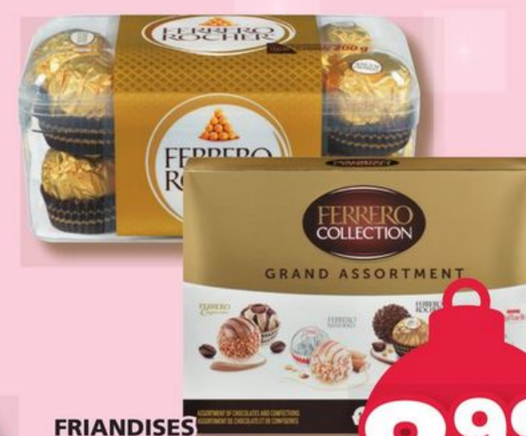
FRIANDISES FERRERO COLLECTION, ROCHER TREATS Emballage de 12 à 16 Pack of 12 to 16