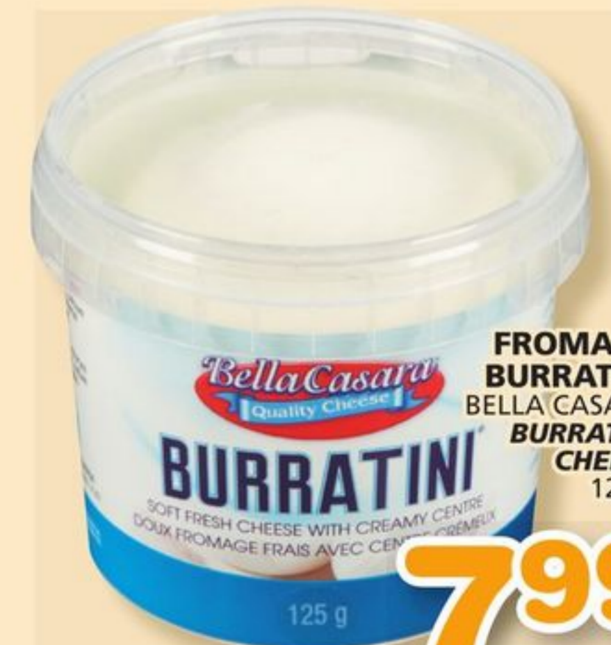
FROMAGE BURRATINI BELLA CASARA BURRATINI CHEESE 125 g