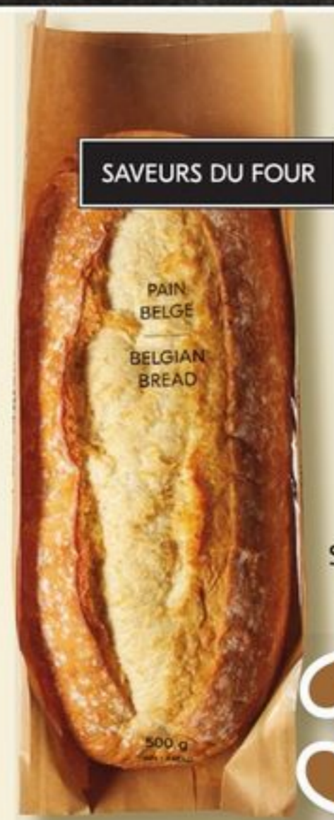
PAIN BELGE SAVEURS DU FOUR BELGIAN BREAD 500 g