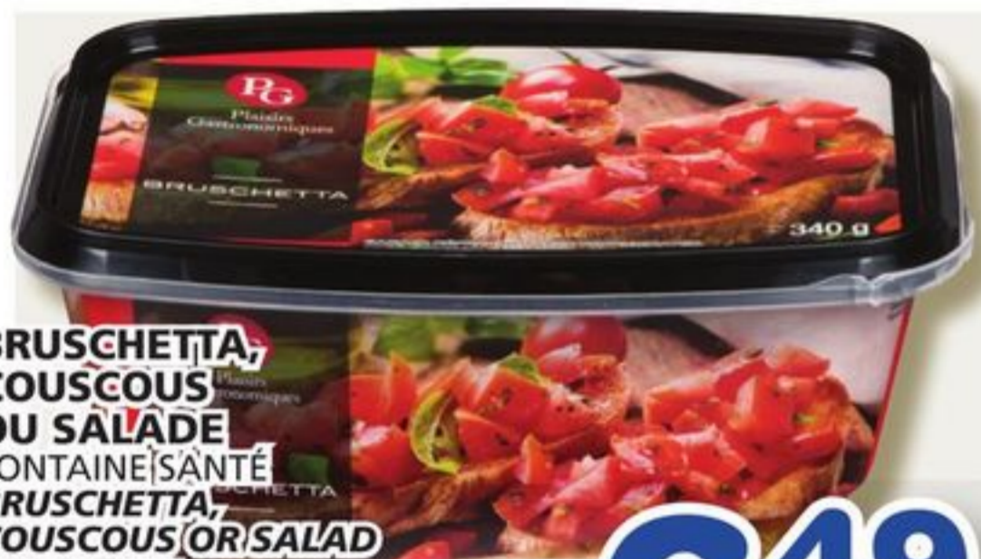
BRUSCHETTA, COUSCOUS OU SALADE FONTAINE S'ANTÉ BRUSCHETTA, COUSCOUS OR SALAD 300 à 375 g Sélection variée Assorted selection