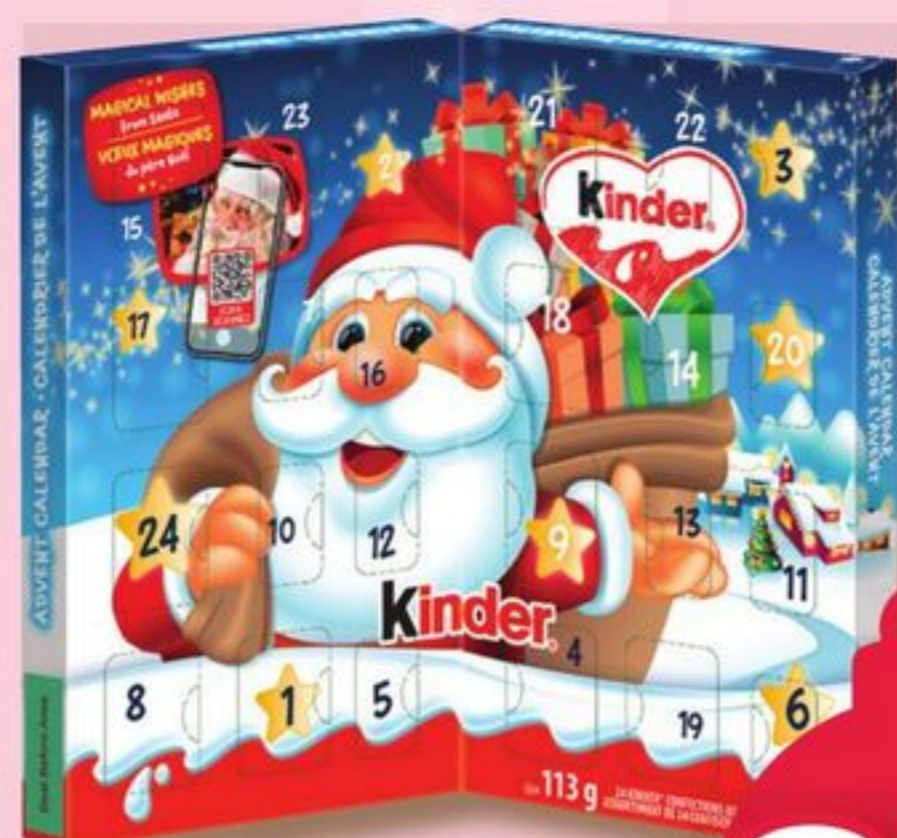
CALENDRIER DE L'AVENT KINDER ADVENT CALENDAR 113 g