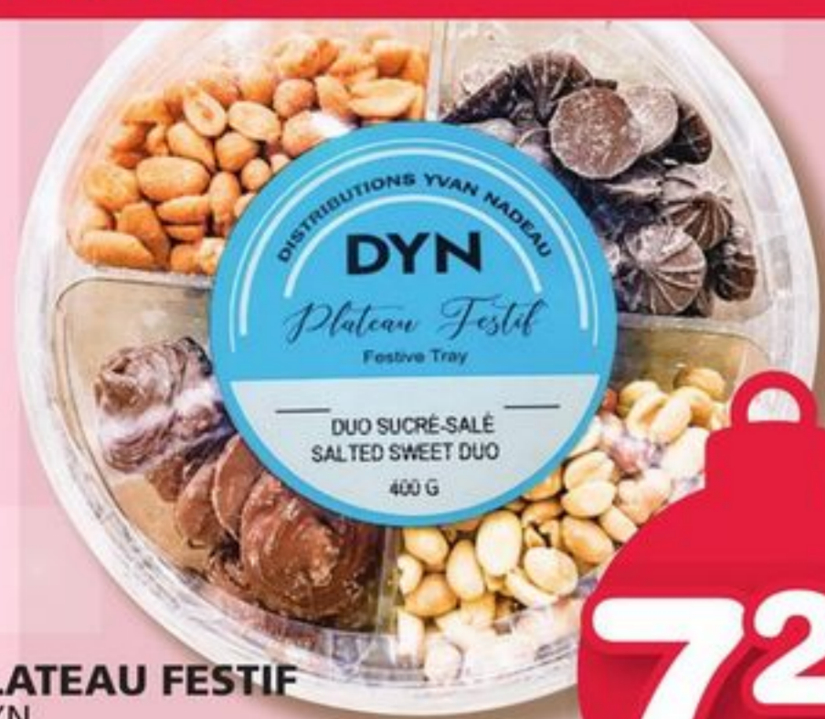
PLATEAU FESTIF DYN Sucré-salé FESTIVE TRAY 400 g