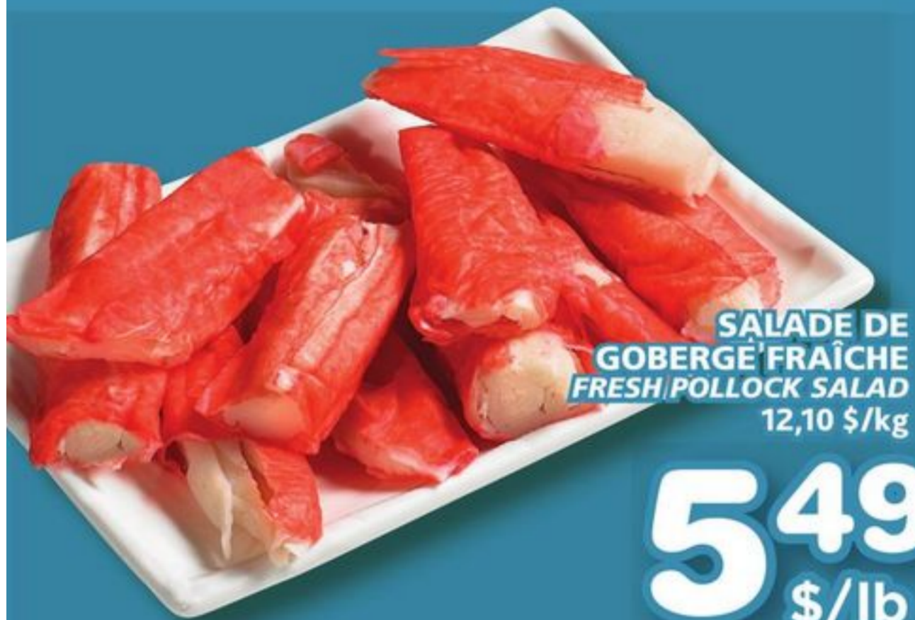
SALADE DE GOBERGÉ FRAÎCHE FRESH POLLOCK SALAD 12,10 $/kg