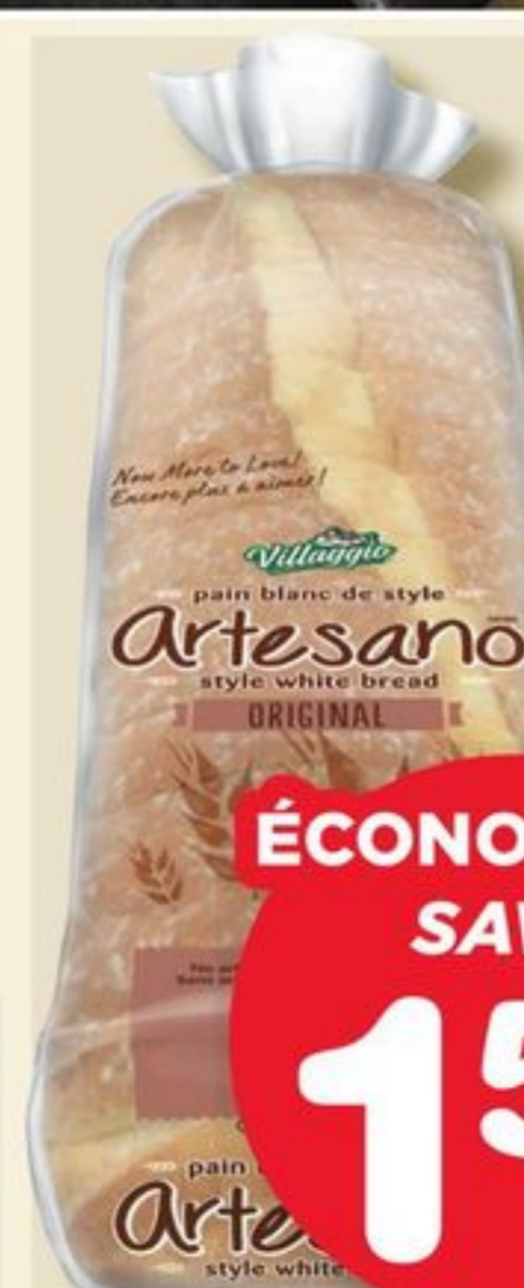
PAIN TRANCHÉ VILLAGGIO SLICED BREAD 550 ou/ou 600 g Sélection variée Assorted selection