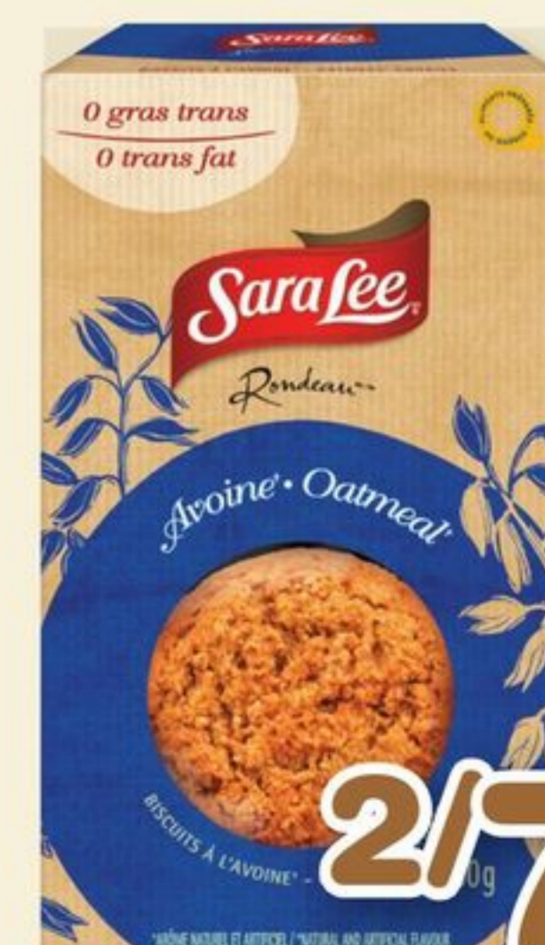
BISCUITS SARA LEE RONDEAU COOKIES 300 g

sur le prix courant à l'achat de 2 on the regular price with the purchase of 2