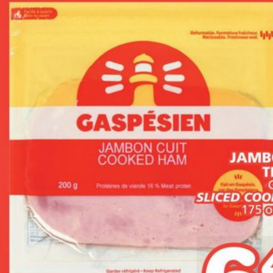
GASPÉSIE JAMBON CUIT COOKED HAM 200 g Protéines de viande 15 % Meat protein