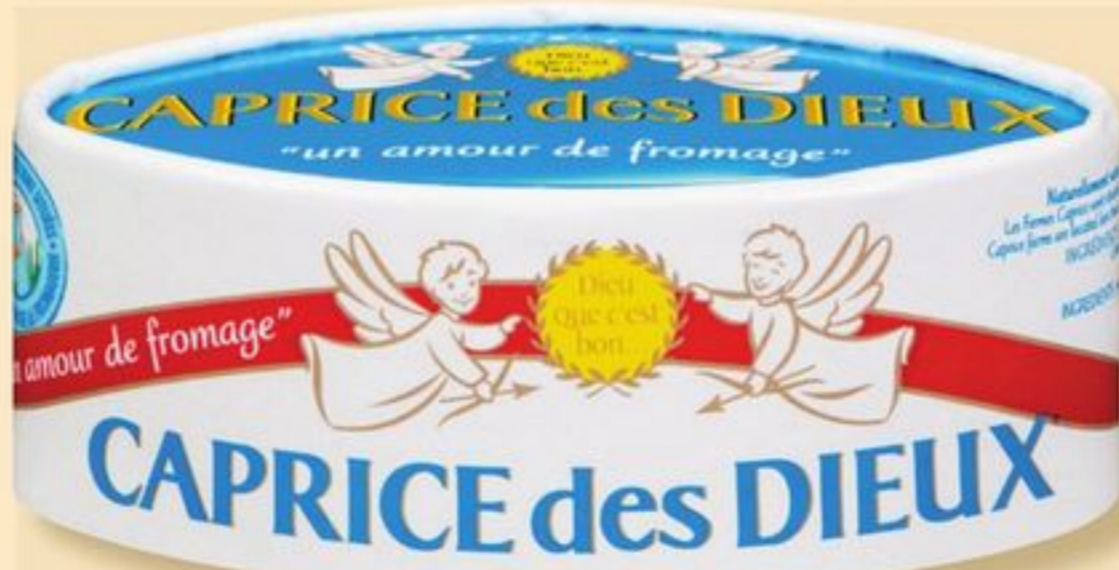
FROMAGE CAPRICE DES DIEUX CAPRICE DES DIEUX CHEESE 125 g