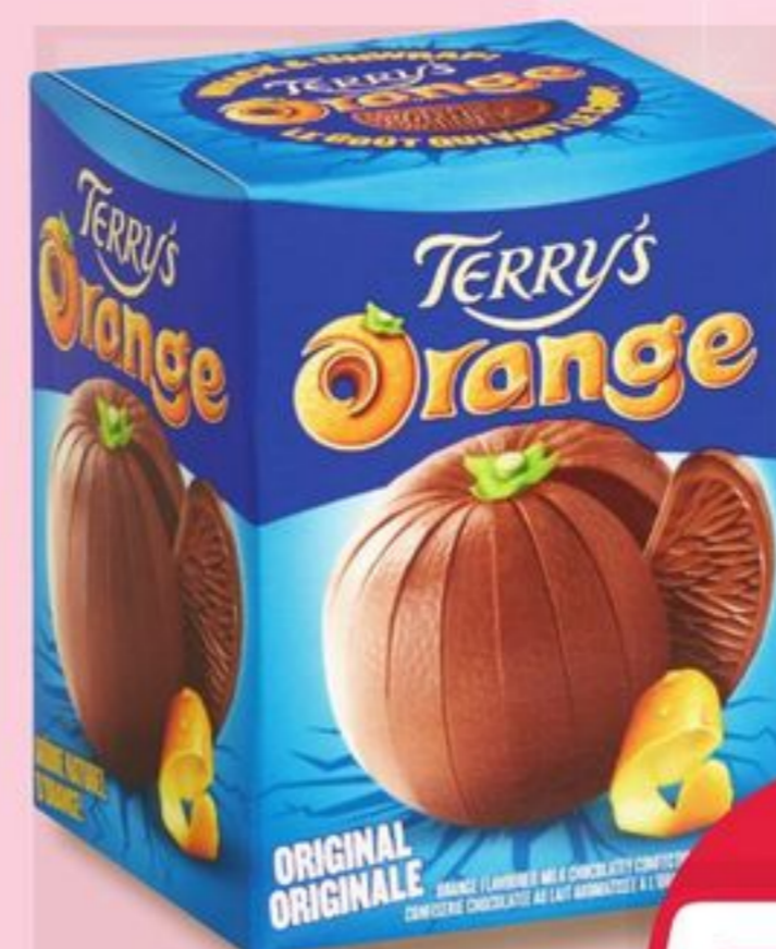
FRIANDISES TERRY'S TREATS 145 à/to 157 g