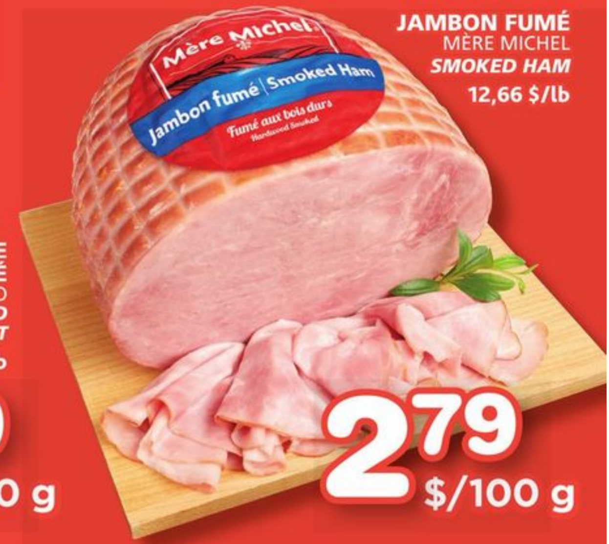
JAMBON FUMÉ MÈRE MICHEL SMOKED HAM 12,66 $/lb