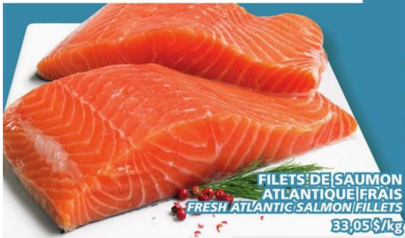
FILETS DE SAUMON ATLANTIQUE FRAIS FRESH ATLANTIC SALMON FILLETS 33,05 $/kg