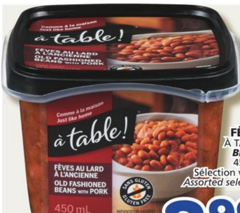
FÈVES À TABLE! BEANS 450 mL Sélection variée Assorted selection