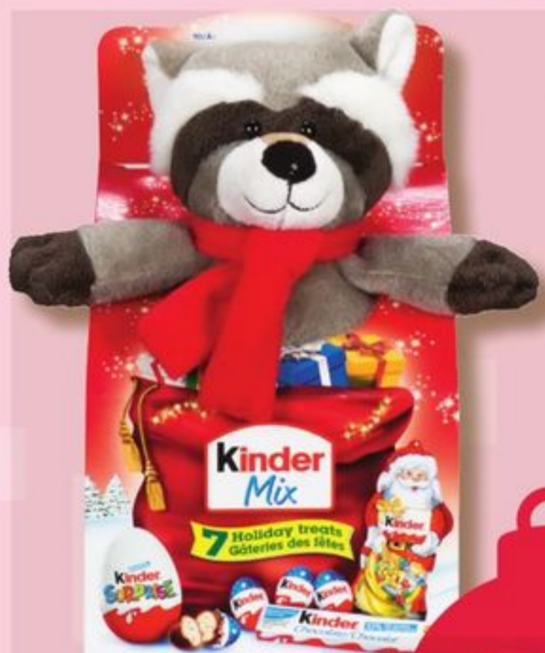
FRIANDISES KINDER MIX SURPRISE TREATS 116 g