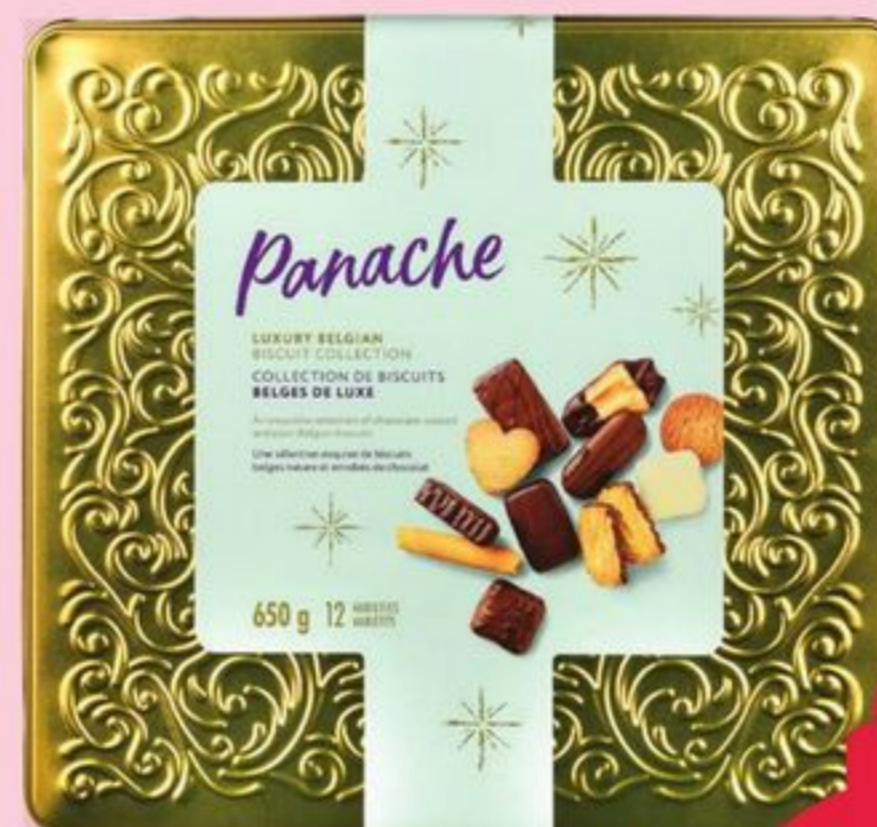
COLLECTION DE BISCUITS BELGES DE LUXE PANACHE LUXURY BELGIAN BISCUIT COLLECTION 650 g