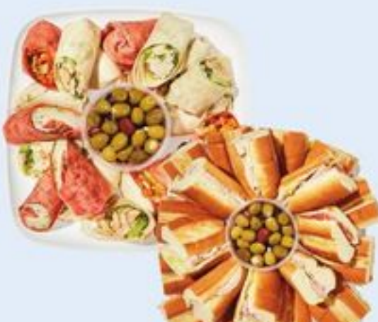
ROULÉS, VÉGÉTARIENS DE LUXE OU GRAND PLATEAU DE SOIR DE MATCH ALL WRAPPED UP, DELUXE VEGETARIAN OR GAME NIGHT LARGE PLATTER 21557920_EA/21558136_EA