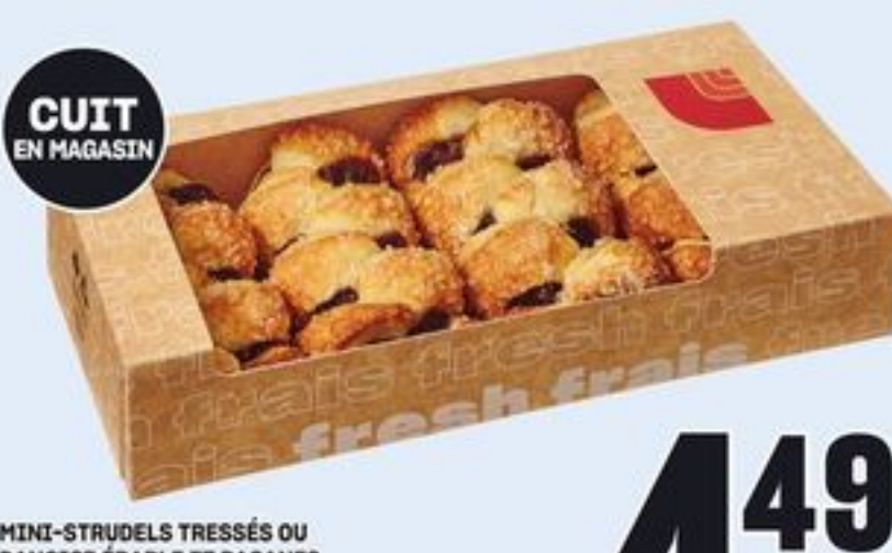
CUIT EN MAGASIN MINI-STRUDELS TRESSÉS OU DANOISE ÉRABLE ET PACANES CERTAINES VARIÉTÉS 4 UN. MINI BRAIDED STRUDELS OR MAPLE PECAN DANISH 21464142_EA