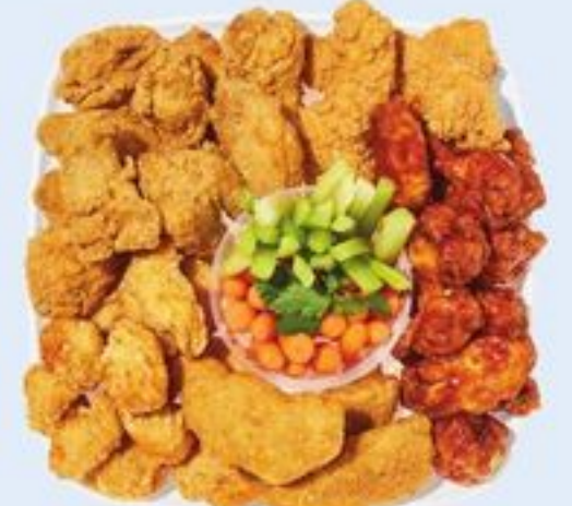
PETIT PLATEAU DE MORCEAUX DE POULET PRÉFÉRÉS CHICKEN FAVOURITES SMALL PLATTER 21559160_EA