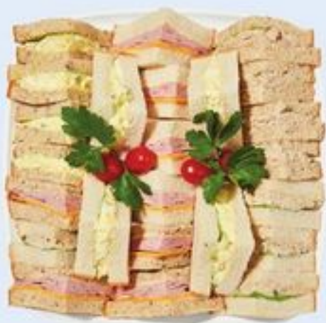
PLATEAU DE SANDWICHS POUR LE THÉ CLASSIQUES CLASSIC TEA SANDWICH PLATTER 21558137_EA