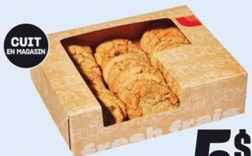
CUIT EN MAGASIN MINI-BISCUITS CERTAINES VARIÉTÉS 24 UN. MINI COOKIES 21596672_EA