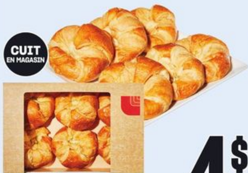
CUIT EN MAGASIN CROISSANTS NATURE 6 UN. PLAIN CROISSANTS 21030153_EA