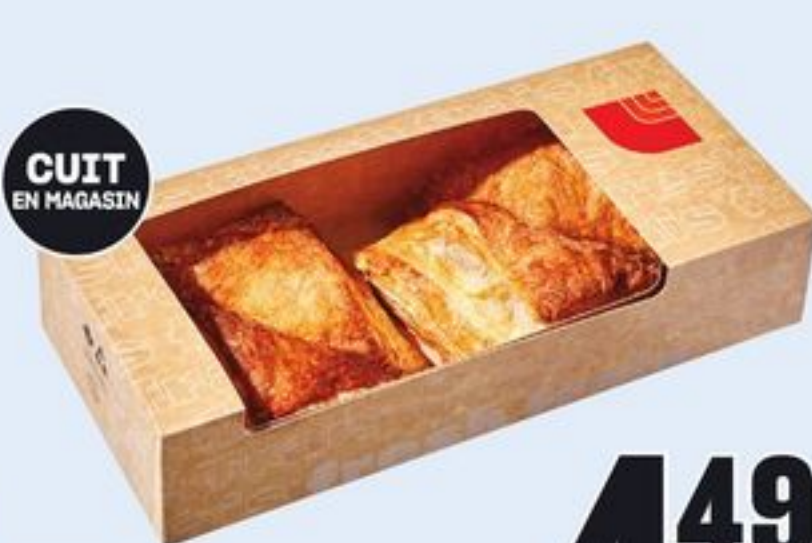
CUIT EN MAGASIN CHAUSSONS CERTAINES VARIÉTÉS 4 UN. TURNOVERS 21469196_EA