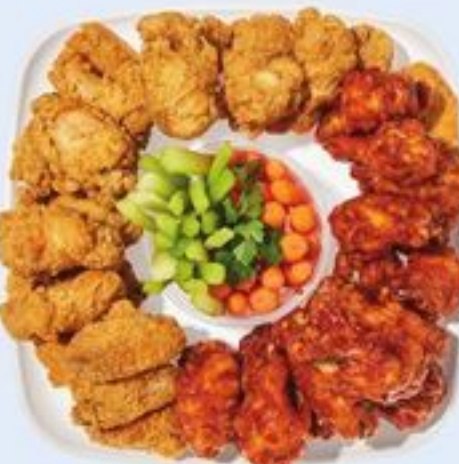
PLATEAU D'AILES DE POULET OU AILES ET FILETS CHICKEN WINGS OR WING N TENDERS PLATTER 21558990_EA