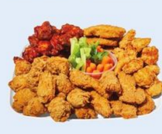
GRAND PLATEAU DE MORCEAUX DE POULET PRÉFÉRÉS CHICKEN FAVOURITES LARGE PLATTER 21559159_EA