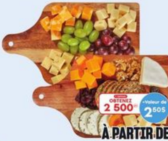
PLANCHES DE CHARCUTERIES CERTAINES VARIÉTÉS 211-433 G CHARCUTERIE BOARDS 21405538_EA/21405571_EA