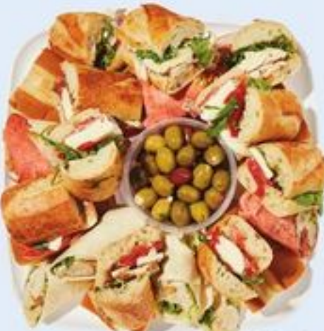
PLATEAU DE RÉCEPTION THE ENTERTAINER PLATTER 21558213_EA