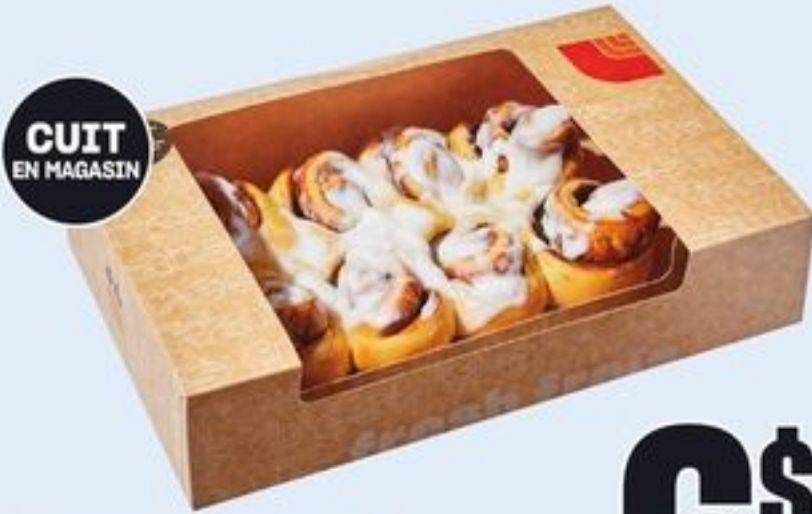
CUIT EN MAGASIN BRIOCHES À LA CANNELLE, DANOISE OU GLAÇAGE AU FROMAGE À LA CRÈME 10 UN. CINNAMON BUNS, DANISH OR CREAM CHEESE ICED 21467583_EA