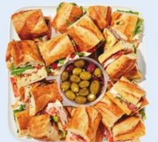
PLATEAU DE SANDWICHS GOURMET GOURMET SANDWICH PLATTER 21558211_EA