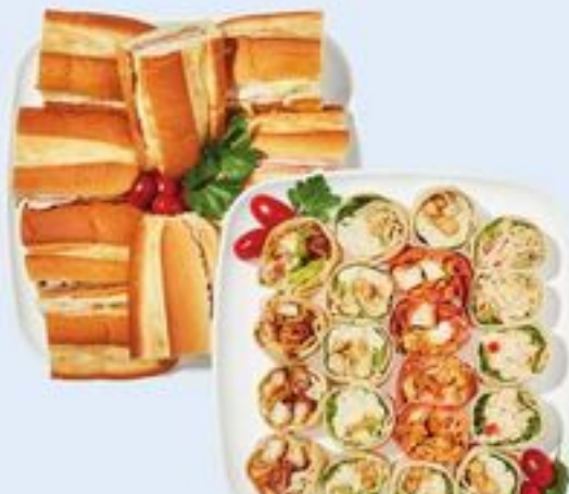
ROULÉS OU PETIT PLATEAU DE SOIR DE MATCH WRAP STARS, PINWHEELS OR GAME NIGHT PLATTER SMALL 21557919_EA/21558135_EA