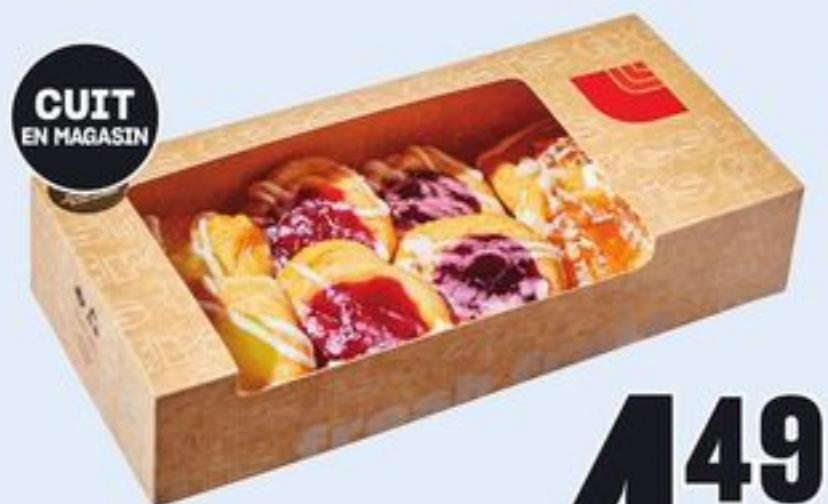
CUIT EN MAGASIN MINI-DANOISES VARIÉES 8 UN. MINI ASSORTED DANISH 21476309_EA