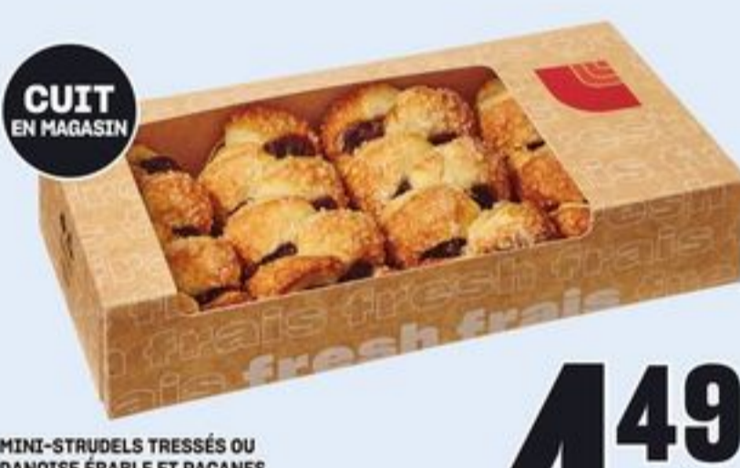
CUIT EN MAGASIN MINI-STRUDELS TRESSÉS OU DANOISE ÉRABLE ET PACANES CERTAINES VARIÉTÉS 4 UN. MINI BRAIDED STRUDELS OR MAPLE PECAN DANISH 21464142_EA