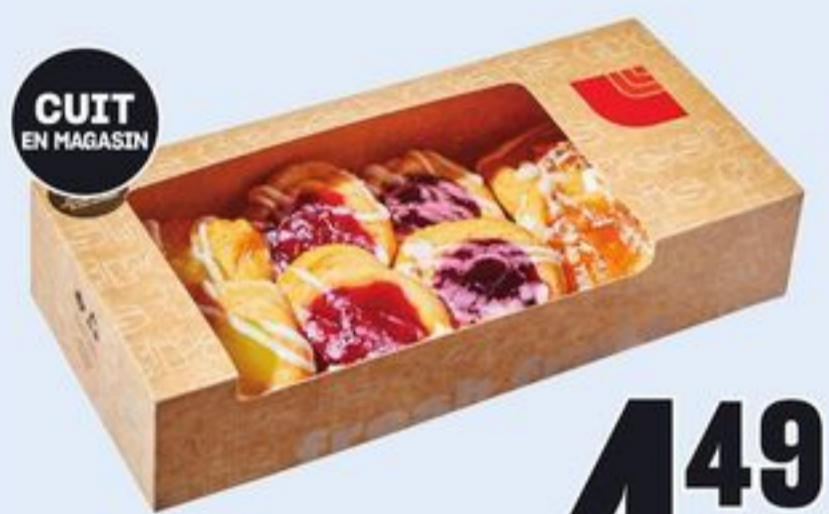
CUIT EN MAGASIN MINI-DANOISES VARIÉES 8 UN. MINI ASSORTED DANISH 21476309_EA