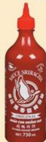
SAUCE SRIRACHA FLYING GOOSE BRAND 730 ML FLYING GOOSE BRAND SRIRACHA SAUCE 21499017_EA