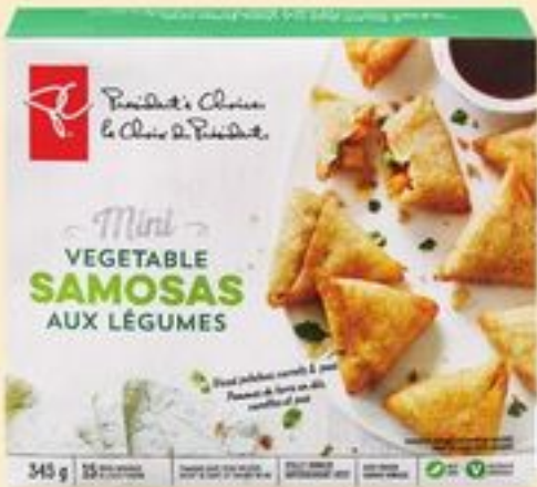
MINI SAMOSAS AUX LÉGUMES PC™ SURGELÉS 345 G PC™ MINI VEGETABLE SAMOSAS 20581030_EA