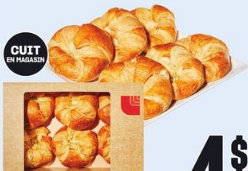
CUIT EN MAGASIN CROISSANTS NATURE 6 UN. PLAIN CROISSANTS 21030153_EA