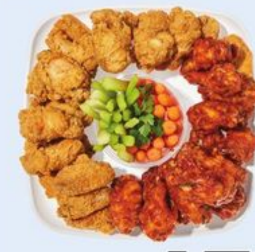
PLATEAU D'AILES DE POULET OU AILES ET FILETS CHICKEN WINGS OR WING N TENDERS PLATTER 21558990_EA