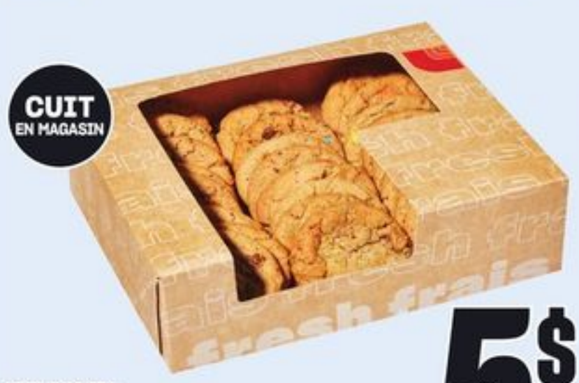
CUIT EN MAGASIN MINI-BISCUITS CERTAINES VARIÉTÉS 24 UN. MINI COOKIES 21596672_EA