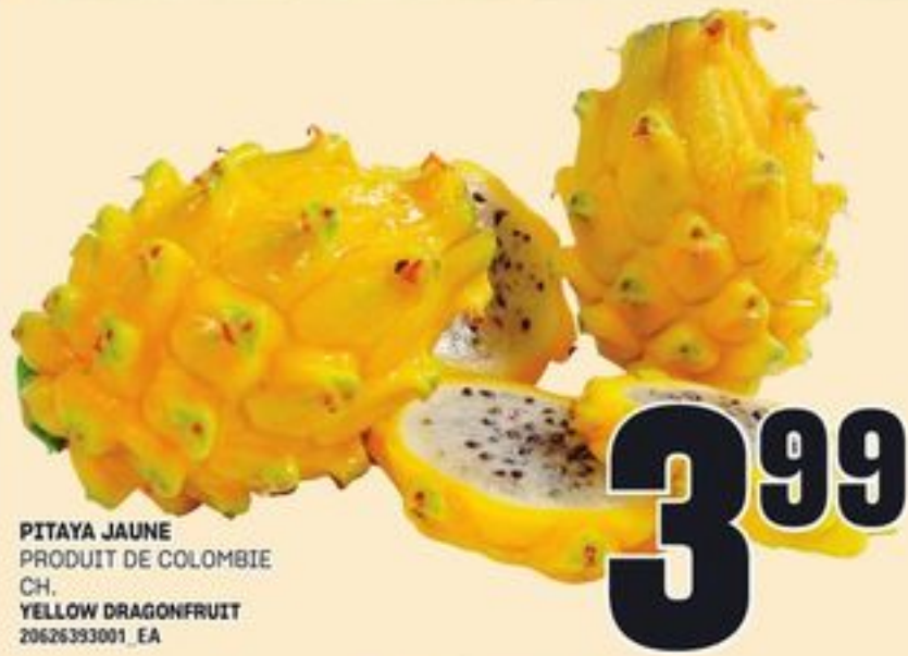
PITAYA JAUNE PRODUIT DE COLOMBIE CH. YELLOW DRAGONFRUIT 20626393001_EA

cliquez ici pour magasiner notre assortiment complet