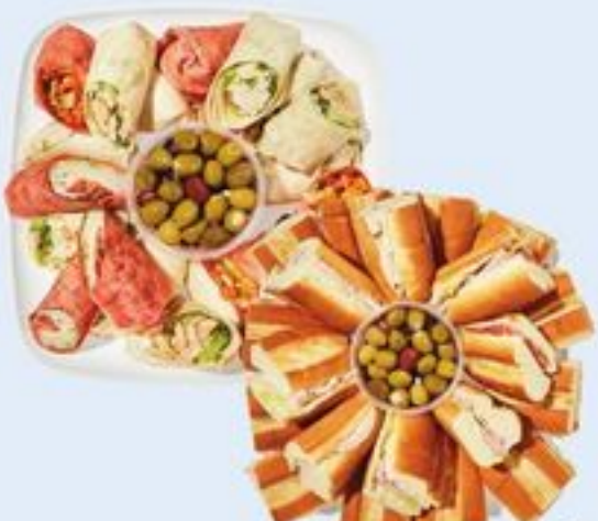
ROULÉS, VÉGÉTARIENS DE LUXE OU GRAND PLATEAU DE SOIR DE MATCH ALL WRAPPED UP, DELUXE VEGETARIAN OR GAME NIGHT LARGE PLATTER 21557920_EA/21558136_EA