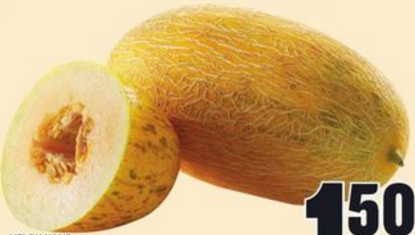
MELON HAMI PRODUIT DES É.-U. 3,31/KG HAMI MELON 21051297001_KG