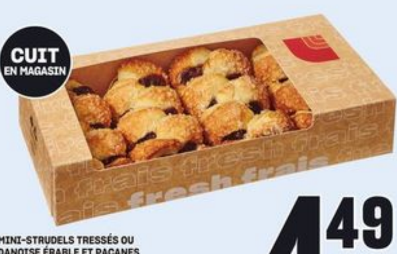
CUIT EN MAGASIN MINI-STRUDELS TRESSÉS OU DANOISE ÉRABLE ET PACANES CERTAINES VARIÉTÉS 4 UN. MINI BRAIDED STRUDELS OR MAPLE PECAN DANISH 21464142_EA