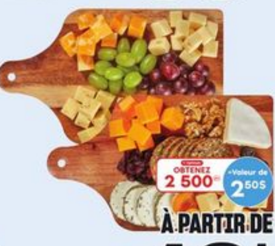
PLANCHES DE CHARCUTERIES CERTAINES VARIÉTÉS 211-433 G CHARCUTERIE BOARDS 21405538_EA/21405571_EA