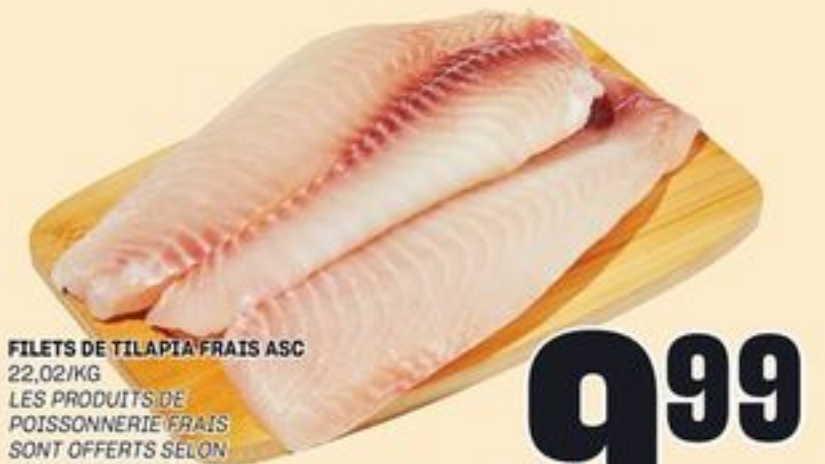
FILETS DE TILAPIA FRAIS ASC 22,02/KG LES PRODUITS DE POISSONNERIE FRAIS SONT OFFERTS SELON LES ARRIVAGES FRESH ASC TILAPIA FILLETS 20897812_KG