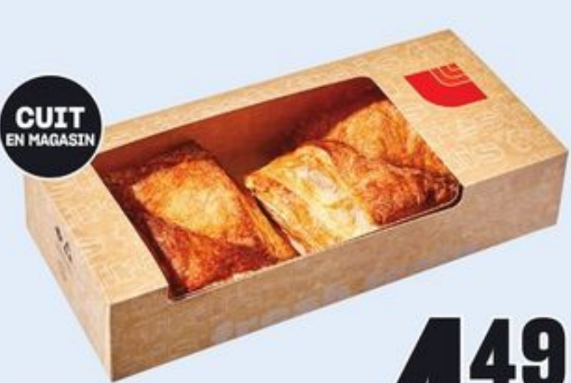
CUIT EN MAGASIN CHAUSSONS CERTAINES VARIÉTÉS 4 UN. TURNOVERS 21469196_EA