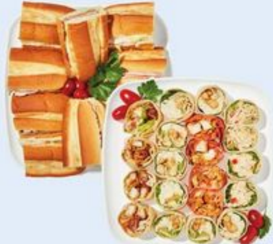
ROULÉS OU PETIT PLATEAU DE SOIR DE MATCH WRAP STARS, PINWHEELS OR GAME NIGHT PLATTER SMALL 21557919_EA/21558135_EA