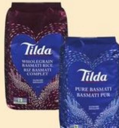
RIZ BASMATI TILDA CERTAINES VARIÉTÉS 4 LB TILDA BASMATI RICE 20013920_EA 20436365_EA