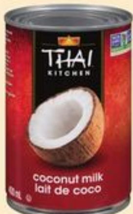
LAIT DE NOIX DE COCO THAI KITCHEN CERTAINES VARIÉTÉS 400 ML THAI KITCHEN COCONUT MILK 20661711_EA