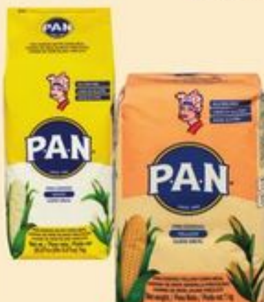
FARINE JAUNE OU BLANCHE PAN 1 KG PAN YELLOW OR WHITE FLOUR 20945695_EA/20945705_EA