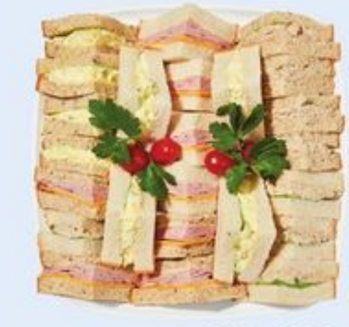
PLATEAU DE SANDWICHS POUR LE THÉ CLASSIQUES CLASSIC TEA SANDWICH PLATTER 21558137_EA