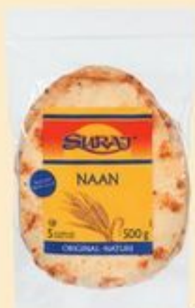
NAAN SURAJ® ORIGINAL 500 G SURAJ® NAAN 21051353_EA