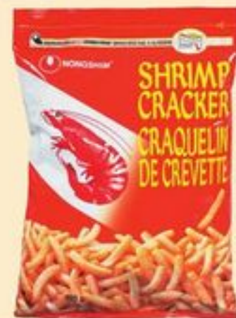
CRAQUELINS AUX CREVETTES NONGSHIM 200-400 G NONGSHIM SHRIMP CRACKERS 20418200_EA