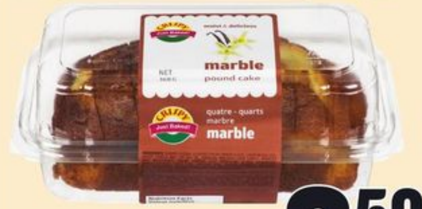
GÂTEAU QUATRE-QUARTS CRISPY CERTAINES VARIÉTÉS 368 G CRISPY POUND CAKE 21623444_EA