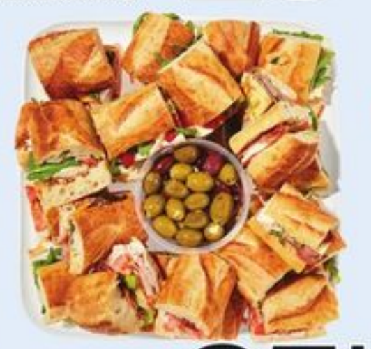
PLATEAU DE SANDWICHS GOURMET GOURMET SANDWICH PLATTER 21558211_EA