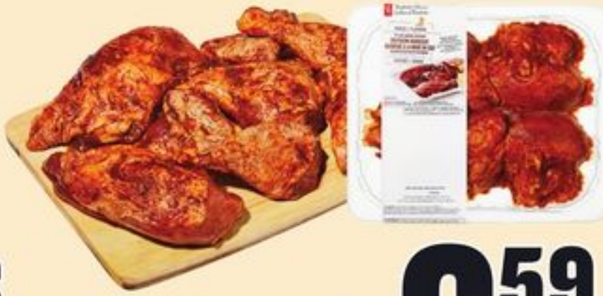
POULET BARBECUE PC™ SAVEURS DU MONDE™ 8 MORCEAUX 14,53/KG PC™ WORLD OF FLAVOURS™ BBQ CHICKEN 21456120_KG