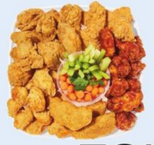
PETIT PLATEAU DE MORCEAUX DE POULET PRÉFÉRÉS CHICKEN FAVOURITES SMALL PLATTER 21559160_EA