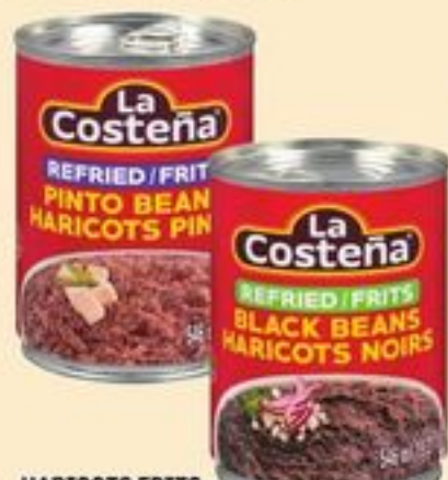
HARICOTS FRITS LA COSTEÑA CERTAINES VARIÉTÉS 536 ML LA COSTEÑA REFRIED BEANS 20054076001_EA 20054076002_EA