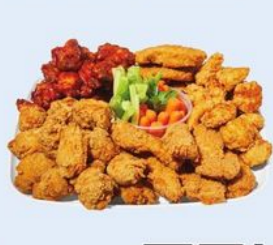
GRAND PLATEAU DE MORCEAUX DE POULET PRÉFÉRÉS CHICKEN FAVOURITES LARGE PLATTER 21559159_EA