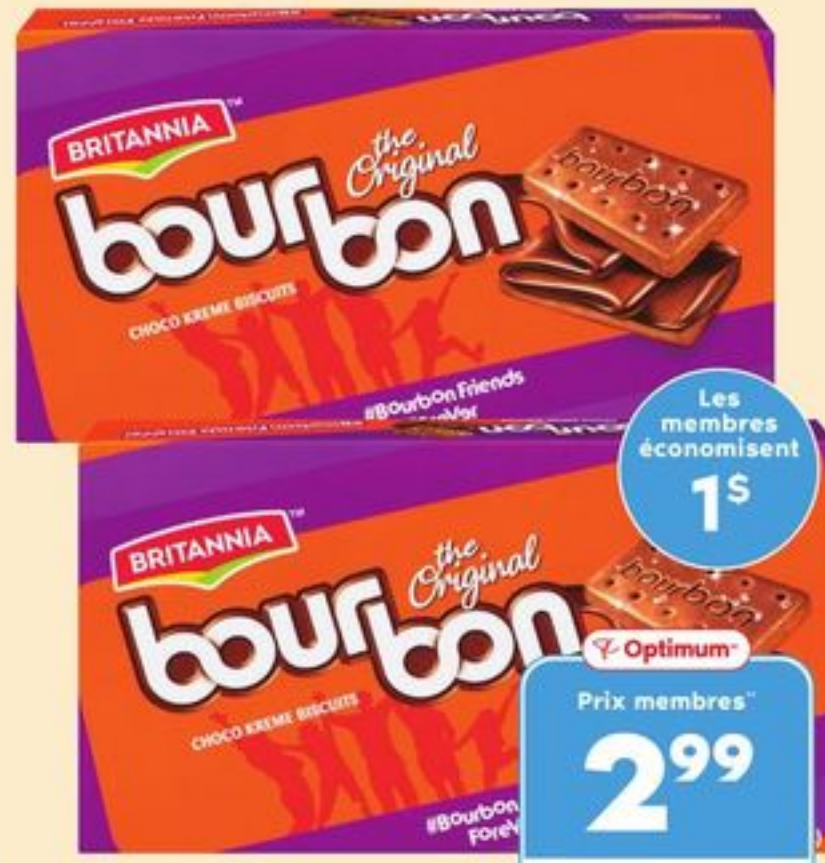
BISCUITS À LA CRÈME BOURBON BRITANNIA 390 G BRITANNIA BOURBON CREAM BISCUIT 20574619_EA