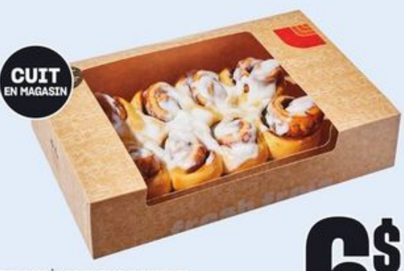
CUIT EN MAGASIN BRIOCHES À LA CANNELLE, DANOISE OU GLAÇAGE AU FROMAGE À LA CRÈME 10 UN. CINNAMON BUNS, DANISH OR CREAM CHEESE ICED 21467583_EA