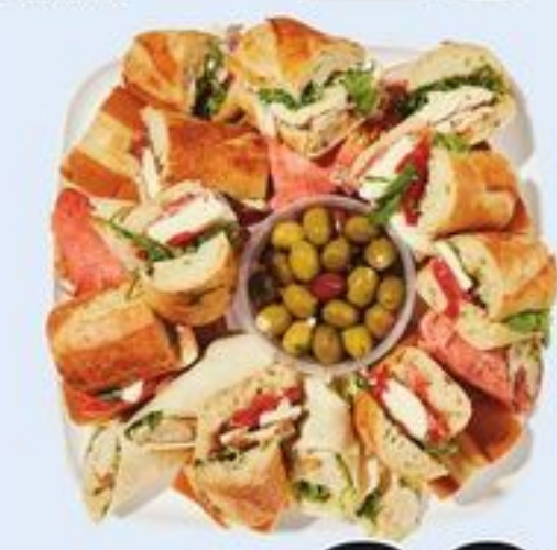
PLATEAU DE RÉCEPTION THE ENTERTAINER PLATTER 21558213_EA