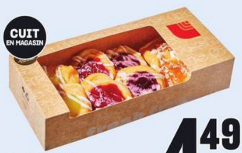
CUIT EN MAGASIN MINI-DANOISES VARIÉES 8 UN. MINI ASSORTED DANISH 21476309_EA