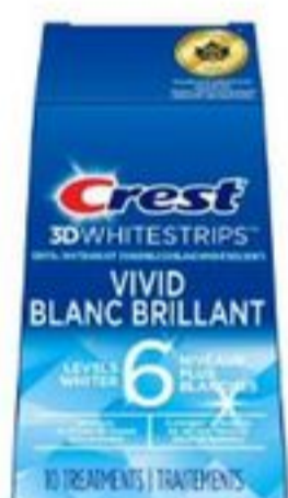
Crest 3D Whitestrips