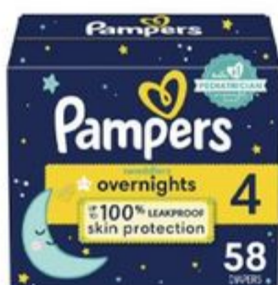
Pampers Swaddlers Overnights Diapers