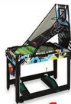
Table de jeu 7 en 1 48 po 48" 7-in-1 Combo Game Table Chac./Each. N° 50243703.