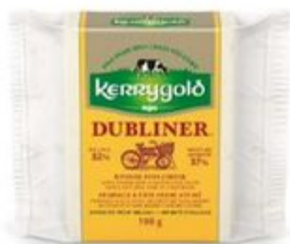
Kerrygold Dubliner Cheese