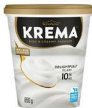
Olympic Krema Yogurt