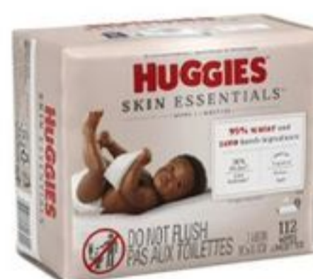
Huggies Skin Essentials Baby Wipes