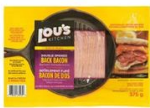
Lou's Kitchen Double Smoked Back Bacon