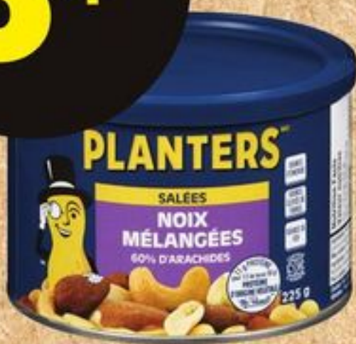
Noix mélangées salées Planters, 225 g Limite de 6, ou 3,50$ ch. après limite Planters salted mixed nuts, 225 g 2162001_CA