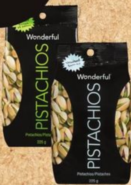
Pistaches Wonderful, salées et sans sel, 225 g Limite de 6, ou 5$ ch. après limite Wonderful salted or unsalted pistachios, 225 g 2108543001_CA, 21018479_CA