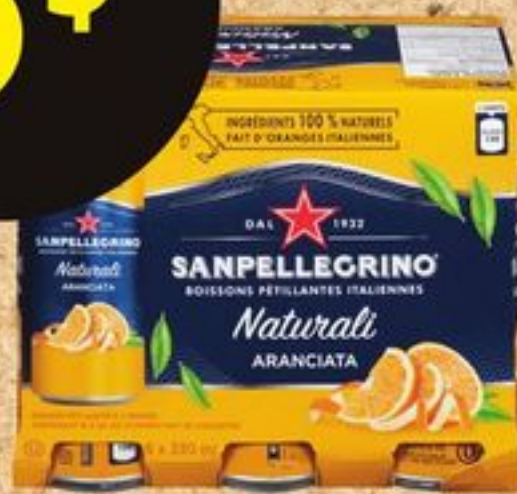
Boissons pétillantes italiennes San Pellegrino, certaines variétés, 6x330 mL Limite de 4, ou 6$ ch. après limite San Pellegrino Italian sparkling beverages, 6x330 mL 21432205_CA