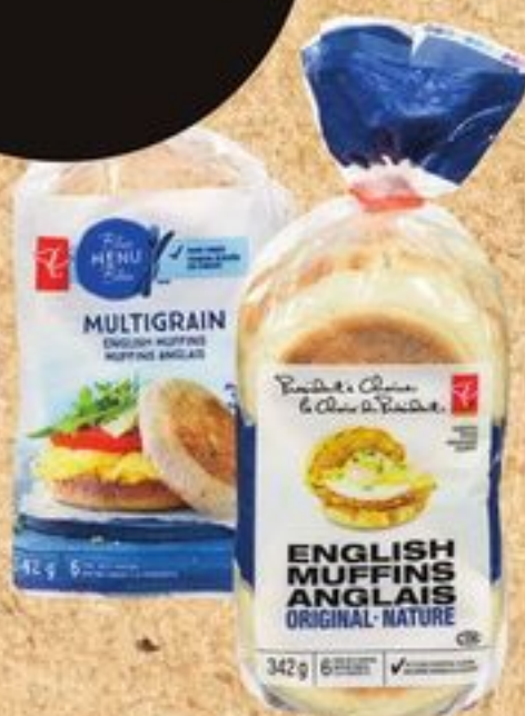
Muffins anglais PC MD ou PC MD Menu Bleu, certaines variétés, 6 un., 342 g Limite de 4, ou 2,99$ ch. après limite PC MD or Blue Menu MD English muffins, 6 un., 342 g 20010079_CA, 20010714_CA