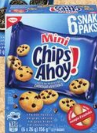
Mini biscuits Snak Paks Christie, certaines variétés, 150-200 g Christie cookies, 150-200 g 71040416_CA, 21531515_CA