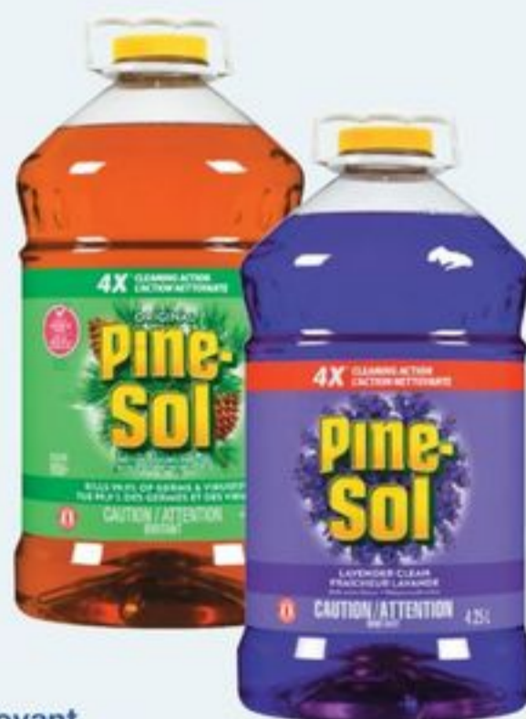
nettoyant certaines variétés 4,27 L Pine-Sol cleaner selected varieties 20021491_EA 21008748_EA