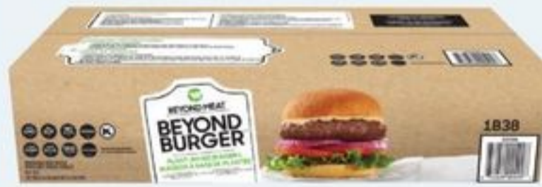
burgers à base de plantes surgelés, 4,53 kg Beyond Burger plant-based burgers frozen 21219840_C01