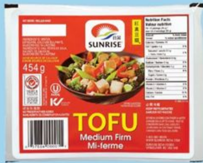
tofu mi-ferme 454 g Sunrise medium firm tofu 20022239_EA