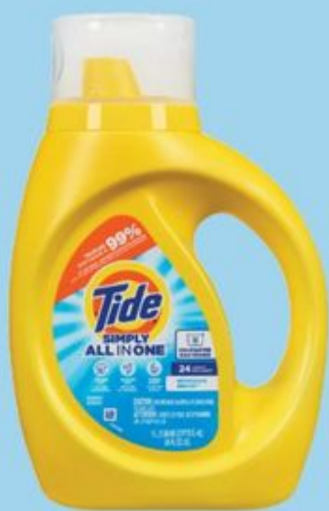
détergent liquide à lessive simply 1 L Tide simply liquid laundry detergent 21589966_EA