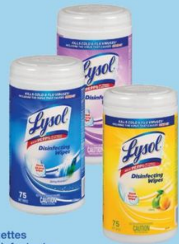
lingettes désinfectantes certaines variétés, 75 un. Lysol disinfecting wipes selected varieties, 75 ct 21449822_EA 21449826_EA 21449829_EA