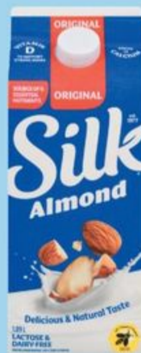
boissons sans produits laitiers certaines variétés réfrigérées, 1,75/1,89 L Silk dairy-free beverages selected varieties refrigerated 20315090001_EA