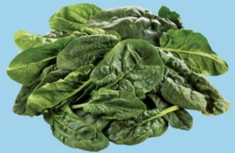
épinards produit des É.-U. 2.5 lb spinach product of U.S.A. 21513556_EA