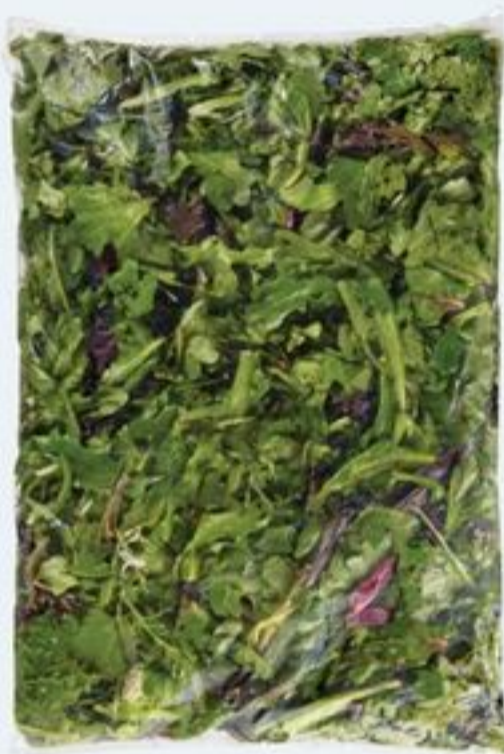
mélange printanier produit des É.-U. 3 lb spring mix product of U.S.A. 20964168_C01