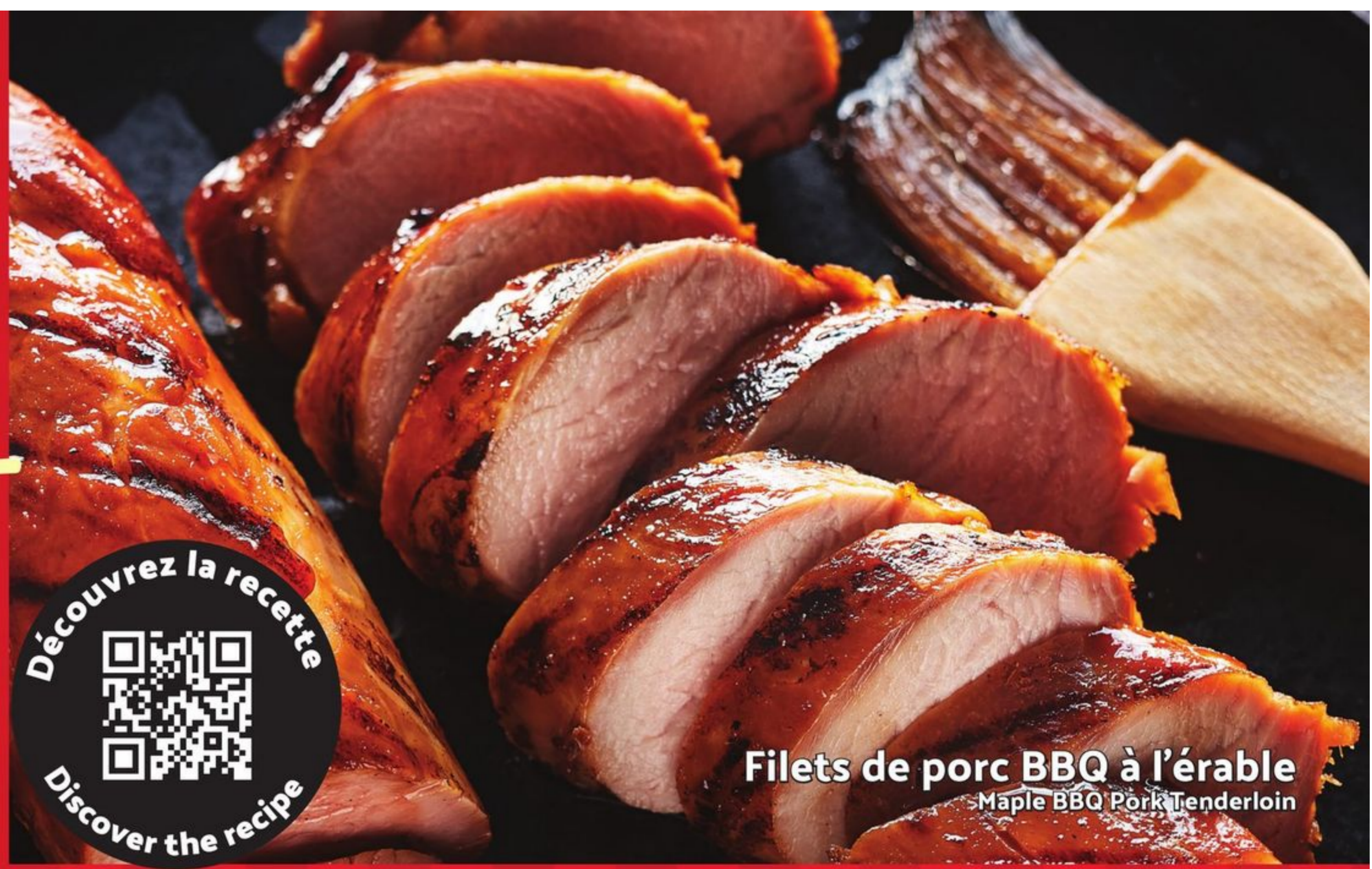
Filets de porc BBQ à l'érable Maple BBQ Pork Tenderloin