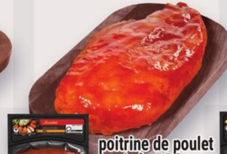
poitrine de poulet marinée BBQ Irrésistible 225 g Irrésistible BBQ marinated chicken breast reg. 6,49