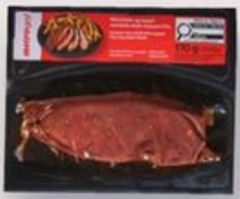
macreuse boeuf Kansas 170 g