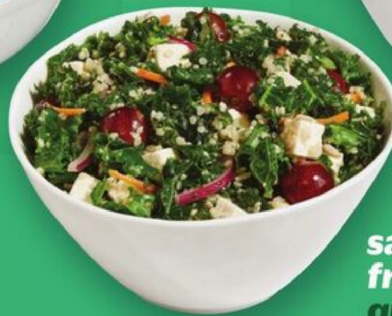
salade chou frisé, feta et quinoa