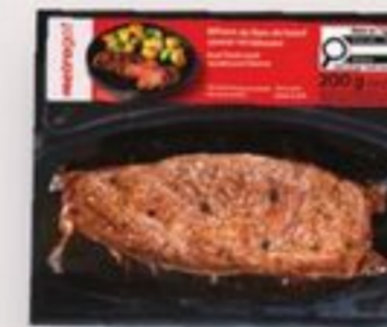
bifteck de flanc steak house 200 g