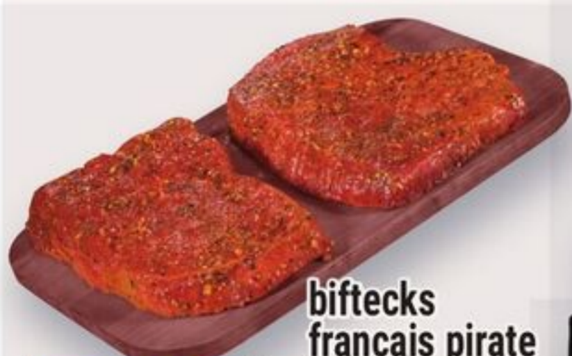
biftecks français pirate format économique pirate french style steaks, economic pack 28,64/kg reg. 13,69/lb - 30,18/kg