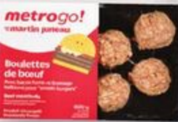
smash burger 6 X 100 g