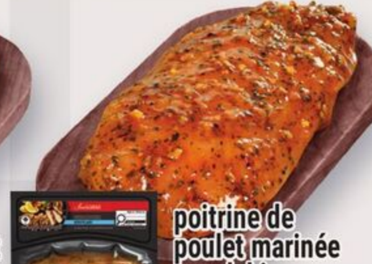
poitrine de poulet marinée souvlaki Irrésistible 225 g Irrésistible souvlaki marinated chicken breast reg. 6,49