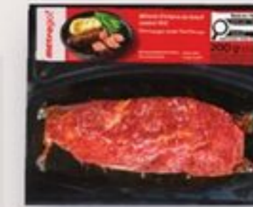
onglet boeuf thai 200 g