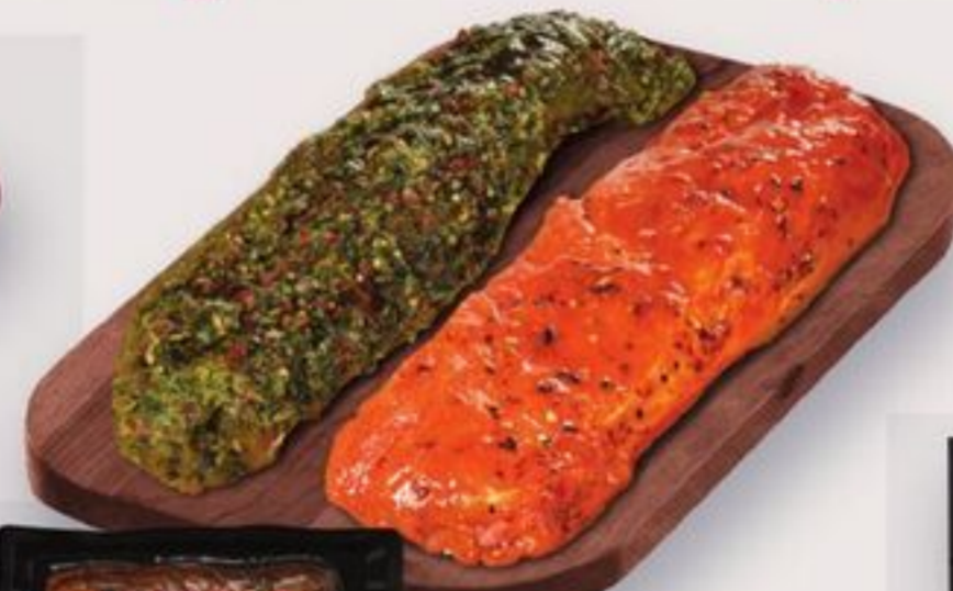
filet de porc Irrésistible 550 g, choix varié Irrésistible pork tenderloin reg. 8,99