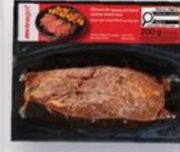
bifteck de hampe mexicain 200 g