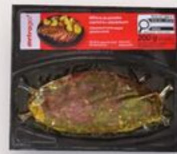
picanha chimichurri 200 g