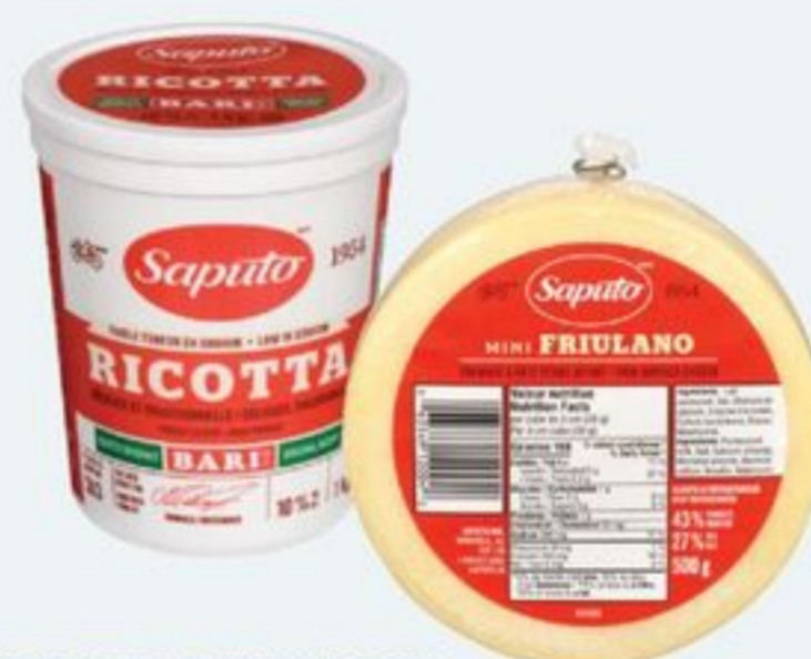
RICOTTA BARI 1 KG OU MINI-FRIULANO SAPUTO 500 G BARI RICOTTA OR SAPUTO MINI FRIULANO CHEESE 500 G 20136427_EA/20708981_EA