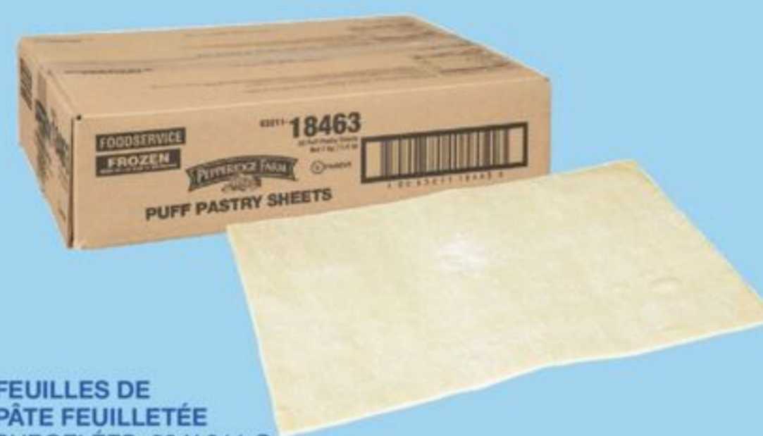
FEUILLES DE PÂTE FEUILLETÉE SURGELÉES, 20 X 311 G PEPPERIDGE FARM PUFF PASTRY SHEETS FROZEN 20089133_EA