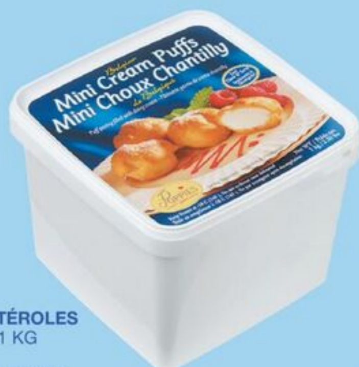
MINI-PROFITÉROLES SURGELÉS, 1 KG POPPIES MINI CREAM PUFFS FROZEN 20501307_EA