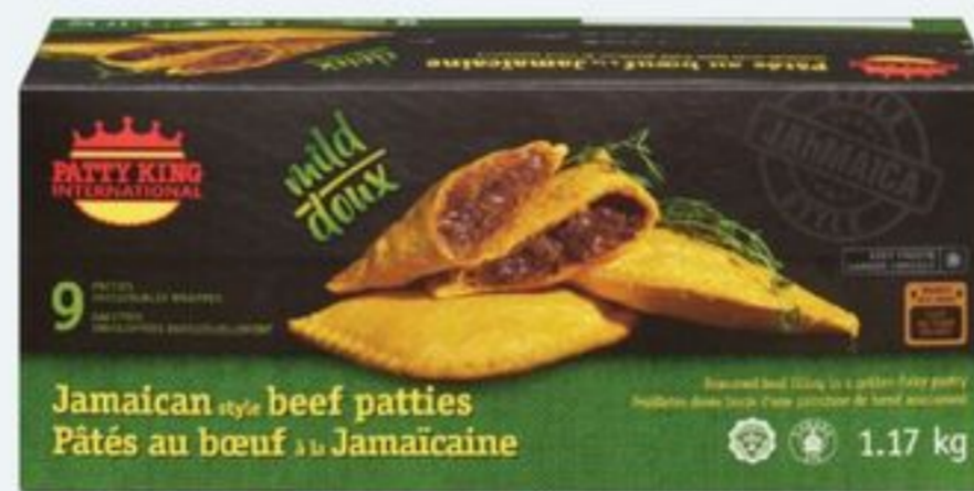
PÂTÉS DE BŒUF À LA JAMAÏCAINE INTERNATIONAL DOUX, 1,17 KG PATTY KING INTERNATIONAL JAMAICAN STYLE BEEF PATTIES MILD 20313668002_EA