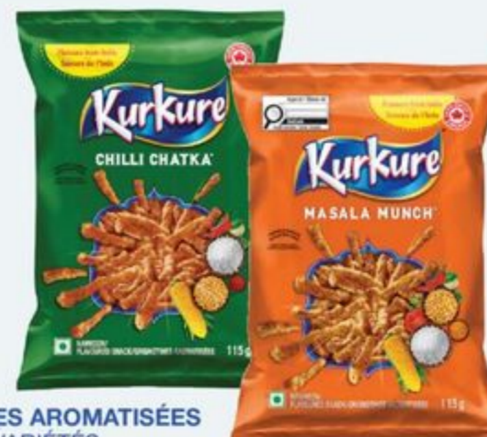
GRIGNOTINES AROMATISÉES CERTAINES VARIÉTÉS 30 X 115 ML TAXES APPLICABLES KURKURE FLAVOURED SNACKS SELECTED VARIETIES 20659742_C30/21361077_C30