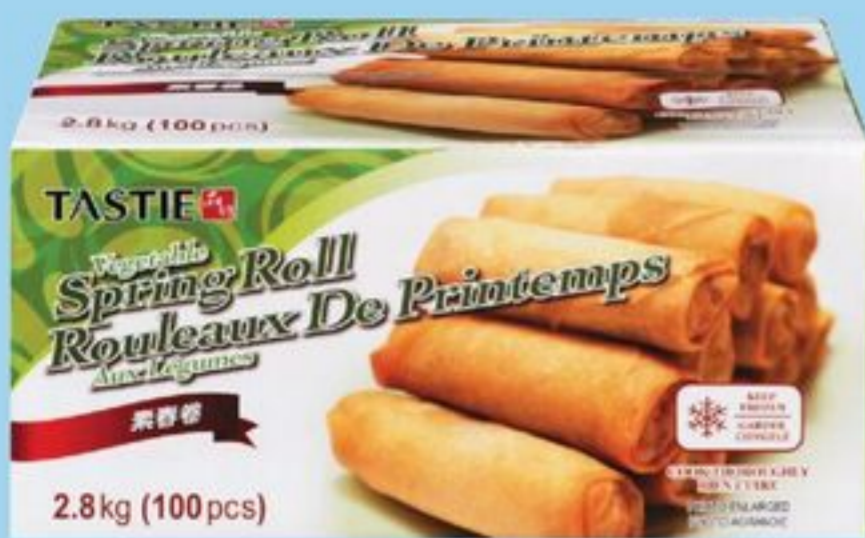
ROULEAUX DE PRINTEMPS AUX LÉGUMES SURGELÉS, 100 UN. TASTIE VEGETABLE SPRING ROLLS FROZEN, 100'S 21207713_EA