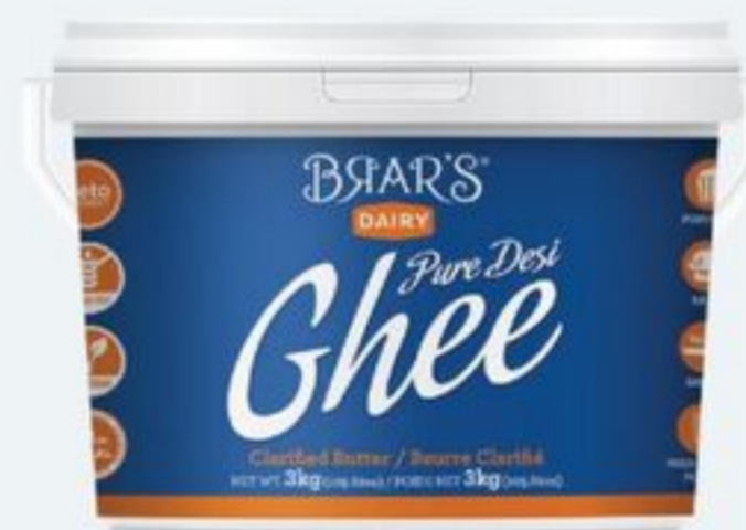
DESI GHEE 3 KG BRAR'S DESI GHEE 21520900_EA