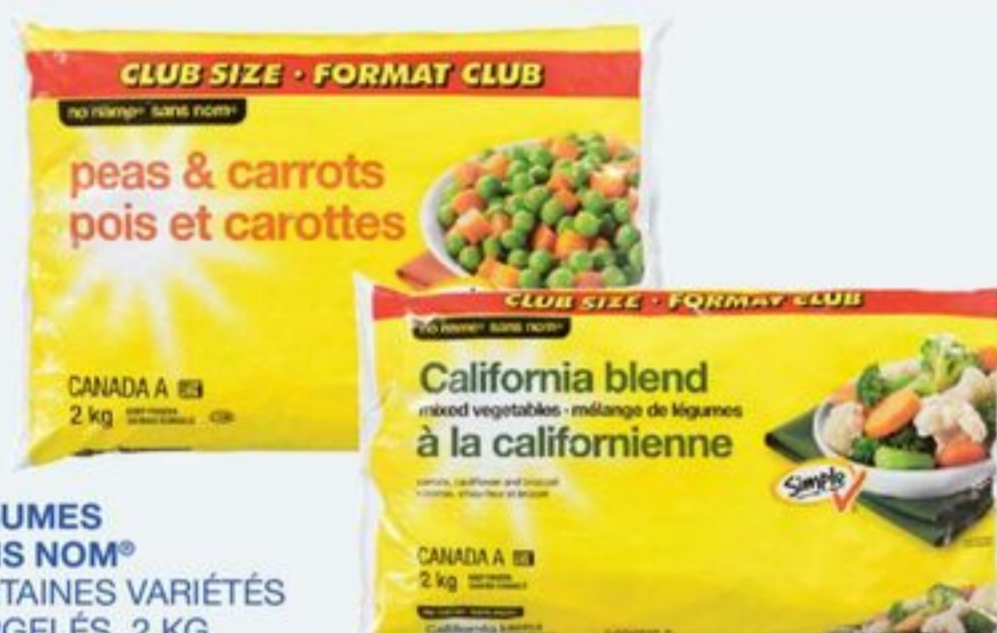
LÉGUMES SANS NOM® CERTAINES VARIÉTÉS SURGELÉS, 2 KG NO NAME® VEGETABLES SELECTED VARIETIES FROZEN 20161396_EA/20185642_EA