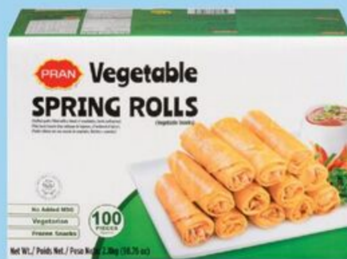
ROULEAUX DE PRINTEMPS 100 UN., 2,8 KG PRAN SPRING ROLLS 100'S 21615971_EA