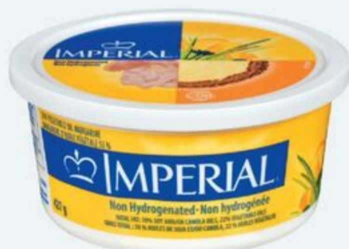
MARGARINE 427 G IMPERIAL MARGARINE 20152424_EA