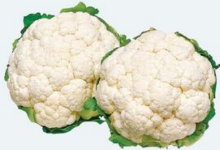
CHOU-FLEUR PRODUIT DES É.-U., CH. CAULIFLOWER PRODUCT OF U.S.A., EACH 20135377001_EA