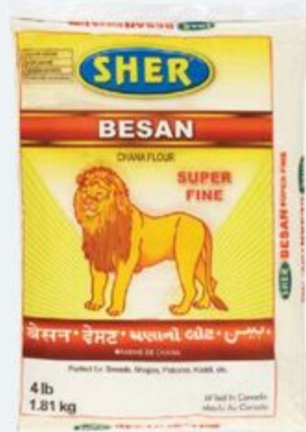
FARINE CHANA 1,81 KG SHER BESAN CHANA FLOUR 20869922_EA