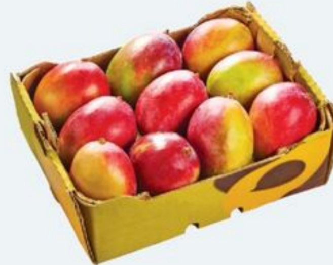
MANGUES ROUGES PRODUIT DES É.-U. 3,75 KG RED MANGOS PRODUCT OF U.S.A. 21047849_C01