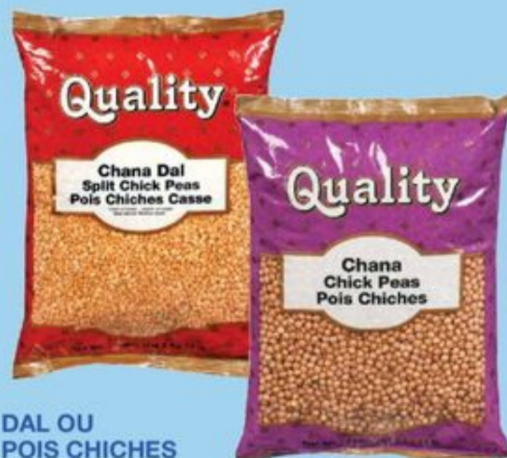
DAL OU POIS CHICHES CHANA 4,99 KG QUALITY CHANA DAL OR CHICK PEAS 20617490_EA/20617921_EA