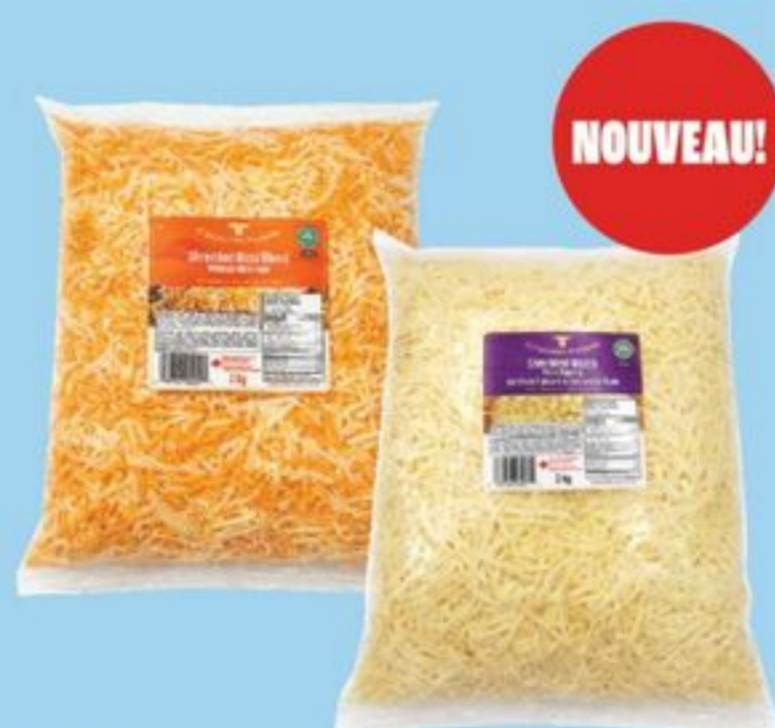
FROMAGE RÂPÉ 2 KG COUNTRY FARMS SHREDDED CHEESE 21721226_EA 21721247_EA