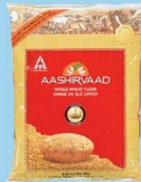
FARINE DE BLÉ ENTIER 9,07 KG AASHIRVAAD WHOLE WHEAT FLOUR 21359688_EA