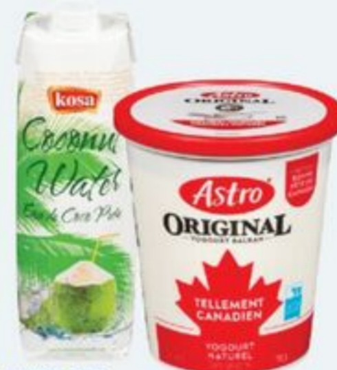
CONTENANTS DE YOGOURT ASTRO 750 G OU EAU DE COCO KOSA 1 L CERTAINES VARIÉTÉS ASTRO YOGURT TUBS OR KOSA COCONUT WATER SELECTED VARIETIES 20165226001_EA/20165226001_EA 21176899_EA