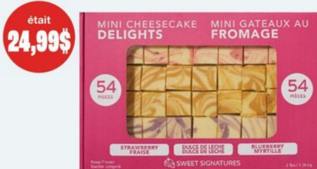
MINI-GÂTEAUX AU FROMAGE 1,36 KG, SURGELÉS SWEET SIGNATURES MINI CHEESECAKE DELIGHTS FROZEN 21616523_EA