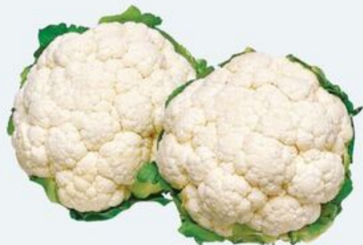
CHOU-FLEUR PRODUIT DES É.-U., CH. CAULIFLOWER PRODUCT OF U.S.A., EACH 20135377001_EA