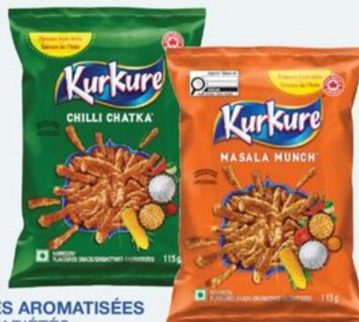
GRIGNOTINES AROMATISÉES CERTAINES VARIÉTÉS 30 X 115 ML TAXES APPLICABLES KURKURE FLAVOURED SNACKS SELECTED VARIETIES 20659742_C30/21361077_C30