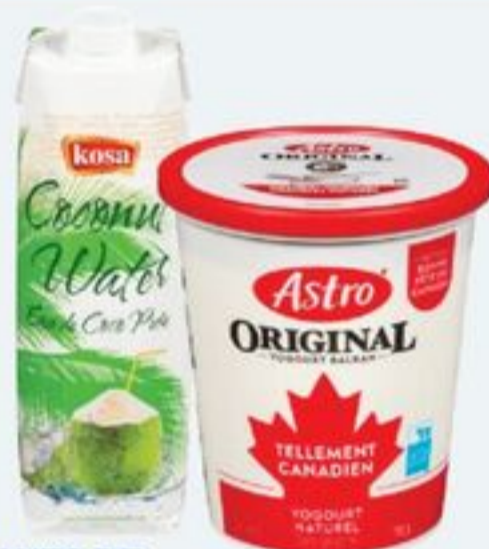
CONTENANTS DE YOGOURT ASTRO 750 G OU EAU DE COCO KOSA 1 L CERTAINES VARIÉTÉS ASTRO YOGURT TUBS OR KOSA COCONUT WATER SELECTED VARIETIES 20165226001_EA/20165226001_EA 21176899_EA