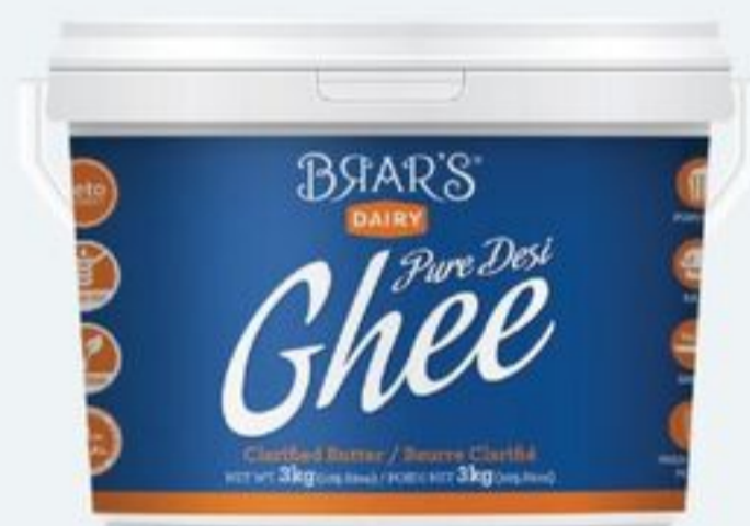
DESI GHEE 3 KG BRAR'S DESI GHEE 21520900_EA