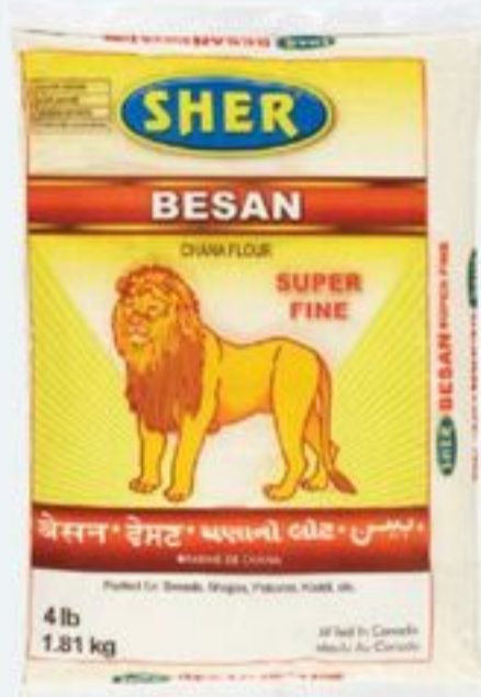
FARINE CHANA 1,81 KG SHER BESAN CHANA FLOUR 20869922_EA