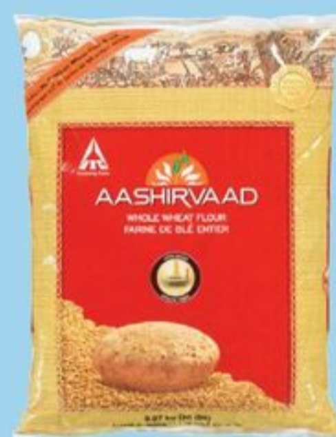
FARINE DE BLÉ ENTIER 9,07 KG AASHIRVAAD WHOLE WHEAT FLOUR 21359688_EA