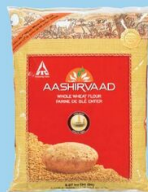
FARINE DE BLÉ ENTIER 9,07 KG AASHIRVAAD WHOLE WHEAT FLOUR 21359688_EA