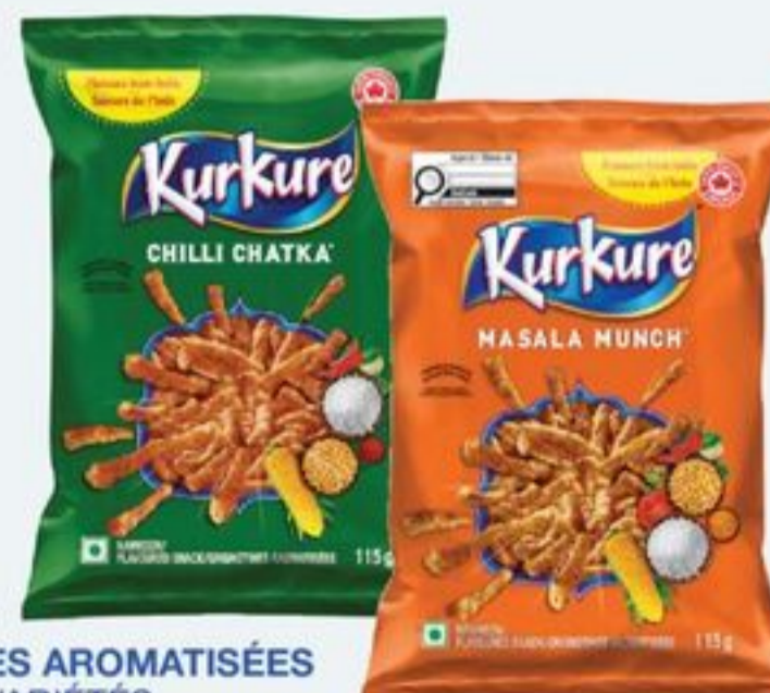
GRIGNOTINES AROMATISÉES CERTAINES VARIÉTÉS 30 X 115 ML TAXES APPLICABLES KURKURE FLAVOURED SNACKS SELECTED VARIETIES 20659742_C30/21361077_C30