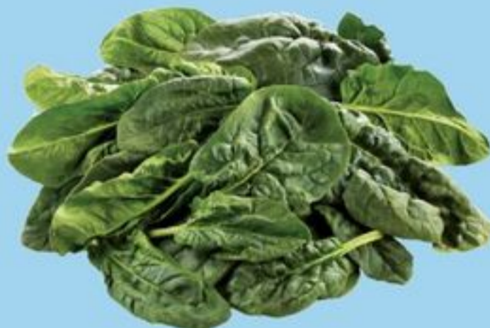
ÉPINARDS PRODUIT DES É.-U. 2,5 LB SPINACH PRODUCT OF U.S.A. 21513556_EA