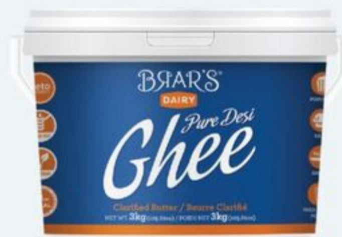
DESI GHEE 3 KG BRAR'S DESI GHEE 21520900_EA