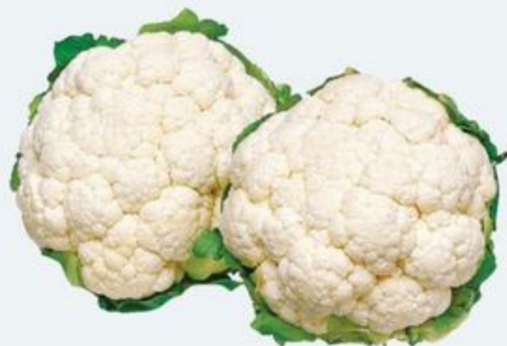
CHOU-FLEUR PRODUIT DES É.-U., CH. CAULIFLOWER PRODUCT OF U.S.A., EACH 20135377001_EA