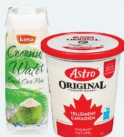
CONTENANTS DE YOGOURT ASTRO 750 G OU EAU DE COCO KOSA 1 L CERTAINES VARIÉTÉS ASTRO YOGURT TUBS OR KOSA COCONUT WATER SELECTED VARIETIES 20165226001_EA/20165226001_EA 21176899_EA