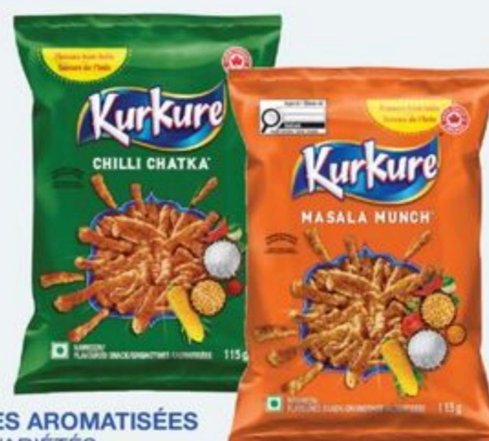
GRIGNOTINES AROMATISÉES CERTAINES VARIÉTÉS 30 X 115 ML TAXES APPLICABLES KURKURE FLAVOURED SNACKS SELECTED VARIETIES 20659742_C30/21361077_C30